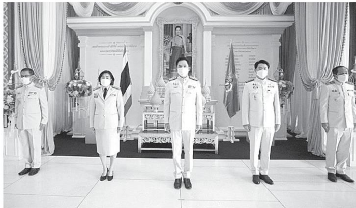
อธิธิพล คุณปลื้ม รมว.วัฒนธรรม พร้อมด้วยผู้บริหาร วธ. ร่วมพิธี ลงนามถวายพระพรชัยมงคลสมเด็จพระนางเจ้าสิริกิติ์ พระบรมราชินีนาถ พระบรม ราชชนนี พันปีหลวง เนื่องในโอกาสวันเฉลิมพระชนมพรรษา 12 สิงหาคม 2564 ที่อาคารวัฒนธรรมวิศิษฐ์ วธ.