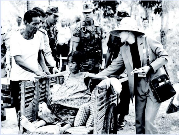
สมเด็จพระพันปีหลวงทอดพระเนตรการทำงานหน่วยแพทย์พระราชทานที่ จ.สกลนคร ปี 2525

กาธิเบศร มหาภูมิพลอดุลยเดชมหาราช บรมนาถบพิตร ไปทรงเยี่ยมเยียนราษฎรทั่วทุกภูมิภาคของประเทศ ทำให้ทรงทราบถึงปัญหาความทุกข์ยากของเหล่าพลกนิกร โดยเฉพาะปัญหาด้านสุขภาพอนามัยตามชนบทห่างไกลว่าประสบความอดอยากยากจน ขาดโอกาสทางการศึกษา และไม่ได้รับการรักษาพยาบาลที่เหมาะสม