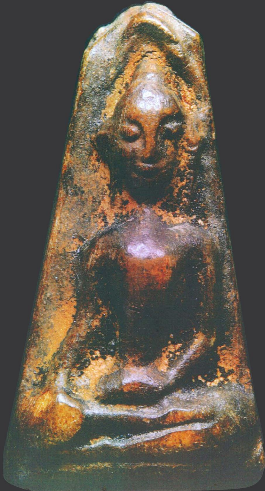
พระพงสุพรรณ พื้ดหน้าหุ้ม วัดพระศรีมหาธาตุ จั้หวัดสุพรรณบุรี ของคุณยืนดี ต่อสุวรรณ