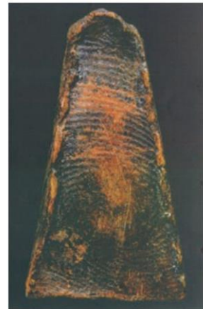
พระผงสุพรรณ พิมพ์หน้าหนุ่ม วัดพระศรีมหาธาตุ จังหวัดสุพรรณบุรี ของคุณยีนดี ต่อสุวรรณ