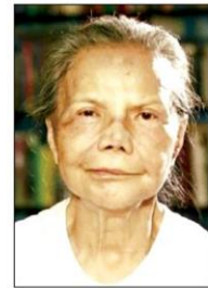
'ทมยันตี' คุณหญิงวิมล ศิริไพบูลย์

แวดวงวรรณกรรมสูญเสียนักประพันธ์ ชื่อดังคุณหญิงวิมล ศิริไพบูลย์ ศิลปินแห่งชาติ เจ้าของนามปากกา 'ทมยันตี'และอีกหลายนามปากกา ☛ ต่อ : ทมยันตี -หน้า 11