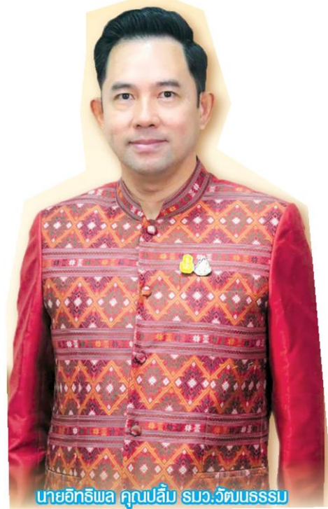
นายอิทธิพล คุณปลื้ม รมว.วัฒนธรรม

เรื่องที่ 2 “10 บาทของครู” เป็นเรื่องของครูใหญ่วัย 73 ปีที่ขายต่อหมกราคา 10 บาททุกวัน เพื่อนำเงินมาเป็นค่าอาหารแก่เด็กยากไร้ในโรงเรียน แต่เงินของครูใหญ่ถูกนักเรียนหญิงขายสองพี่น้องขโมย นักเรียนหญิงนำไปช่วยเหลือแม่ที่นอนป่วยอยู่บ้าน ขณะที่นักเรียนชายนำเงินไปเล่นเกม เมื่อครูใหญ่รู้เรื่องจึงตามไปที่บ้านและให้เงินช่วยเหลือ ส่วนนักเรียนชายกลับบ้านมาเห็นครูใหญ่นำเงินมาช่วยเหลือแม่ เขาจึงได้ช่วยครูใหญ่ขายของอย่างภาคภูมิใจ