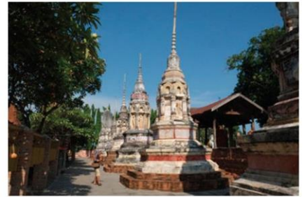
รัตนเจดีย์ วัดจามเทวี ลำพูน เจดีย์แปดเหลี่ยมที่เก่าที่สุดในประเทศไทย ศิลปะหริภุญไชย