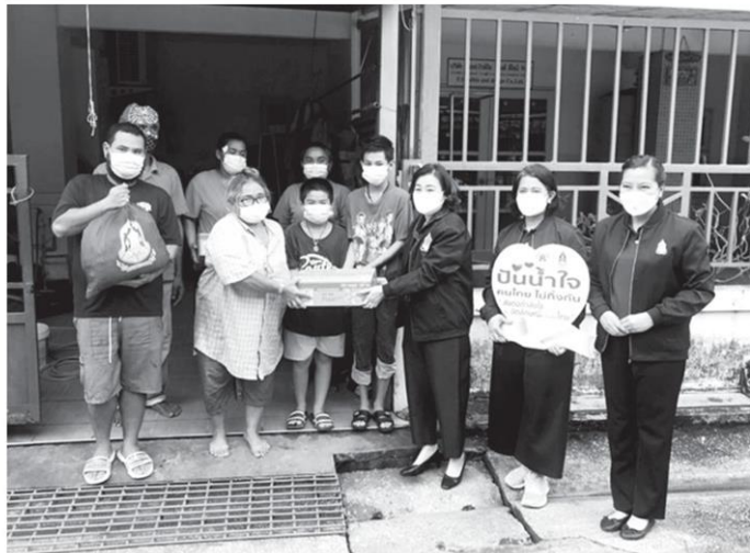
"ปันน้ำใจ คนไทยไม่ทิ้งกัน" - นางยุพา ทวีวัฒนะกิจบวร ปลัดกระทรวงวัฒนธรรม และคณะ ร่วมกับกลุ่มจิตอาสาดูแลไทย (Jitasa.Care) และหลักสูตรธรรมมาภิบาลทางการแพทย์ (ปรท.9) ลงพื้นที่มอบถุงยังชีพแก่ชาวปทุมธานีที่ได้รับผลกระทบจากการแพร่ระบาดของโรคติดเชื้อไวรัสโคโรนา-19 ที่อยู่ระหว่างการกักตัวดูแลรักษาตนเอง (Home Isolation) และแจ้งขอความช่วยเหลือผ่าน jitasa.care เมื่อเร็วๆ นี้