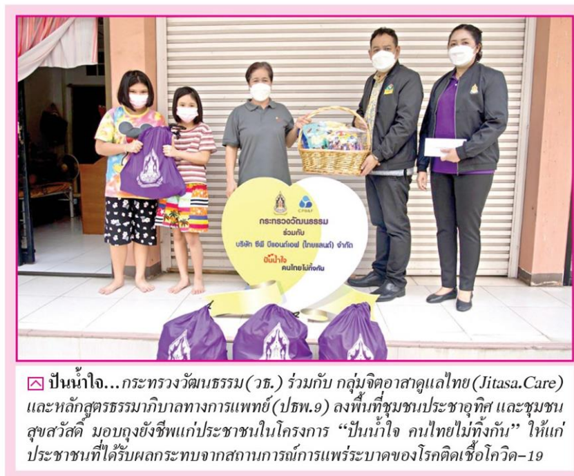
☑ ปันน้ำใจ...กระทรวงวัฒนธรรม(วธ.) ร่วมกับ กลุ่มจิตอาสาดูแลไทย(Jitasa.Care) และหลักสูตรธรรมาภิบาลทางการแพทย์(ปธพ.9) ลงพื้นที่ชุมชนประชาชนอุทิศ และชุมชนสุขสวัสดิ์ มอบถุงยังชีพแก่ประชาชนในโครงการ “ปันน้ำใจ คนไทยไม่ทิ้งกัน” ให้แก่ประชาชนที่ได้รับผลกระทบจากสถานการณ์การแพร่ระบาดของโรคติดเชื้อโควิด-19