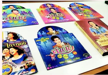
จัดแสดงวีดิทัศน์บันทึกการแสดงลำตัดแม่ประยูร

คาสเซ็ท และวีดิทัศน์ชุดตั้งตั้งแต่อดีตจนถึง