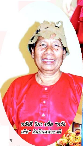
หวังดี นิมา หรือ “หวังเต๊ะ” ศิลปินแห่งชาติ