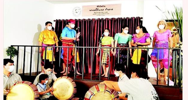
การแสดงลำตัดคณะ “หวังเต๊ะ” ในวันเปิดบ้านแม่ศรีนวล