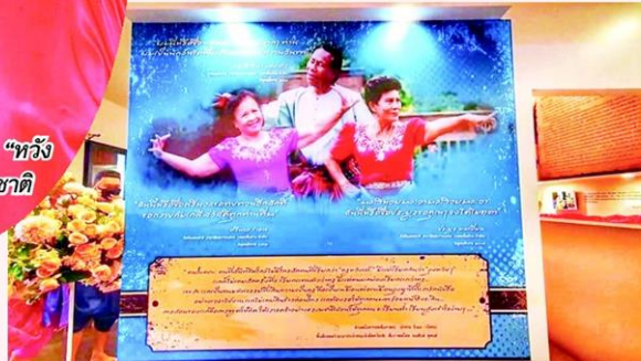
รวบรวมเส้นทางชีวิต 3 ศิลปินแห่งชาติลำดับถัดมาไว้สถานที่เดียว