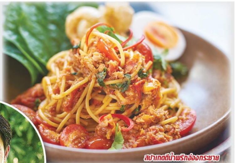
สปาเกตตีน้ำพริกอ่องกระชาย

บ้านที่เป็นเจ้าของมรดกมาต่อยอด อาหารไทยคือละมุนภักดิ์ (Soft Power) มีศักยภาพในการเข้าถึงนานาชาติประเทศ ทำให้มั่นใจว่าโครงการนี้ จะต่อยอดให้ทั่วโลกเชื่อมั่นในความอร่อยของอาหารไทย และยังสร้างมุมมองใหม่ว่า อาหารไทยเป็น "ยาที่อร่อยที่สุดในโลก" ได้แน่นอน