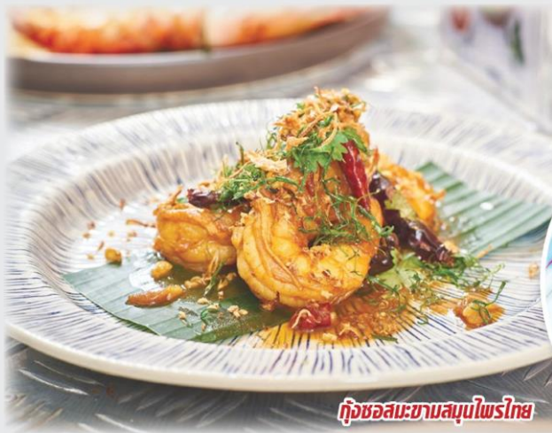
กุ้งชอสมะขามสมุนไพรไทย

วัฒนศักดิ์ ช่างเก็บ เมนูข้าวมันตะไคร้หน้าหมูย่าง ราคชออสฟริก ไทยดำไขจดอน้ำปลา ฯลฯ.