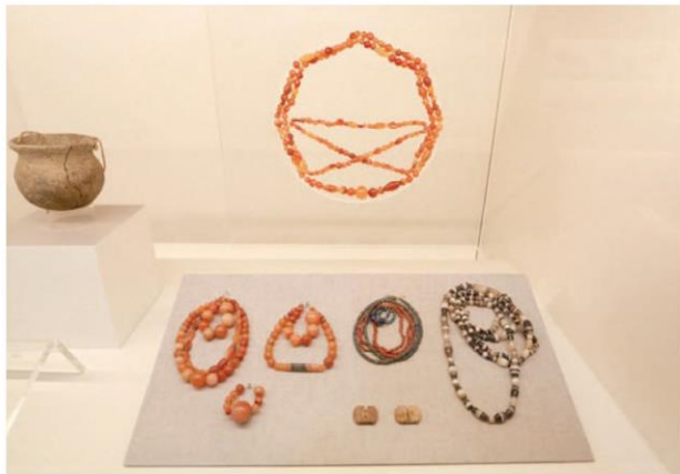
Ancient artefacts exhibited at Ban Kao National Museum โบราณวัตถุ จัดแสดง ณ พิพิธภัณฑ์สถานแห่งชาติ บ้านเก่า