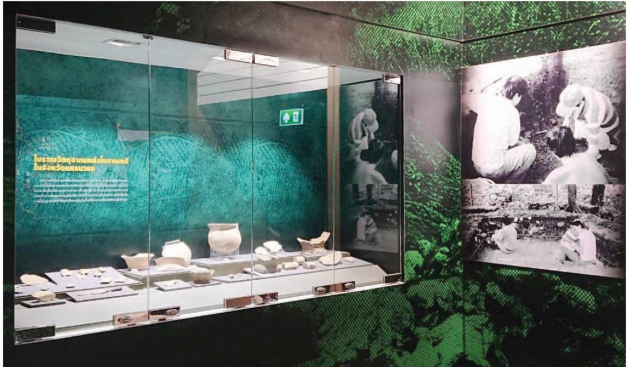
National Museum Nakhon Nayok Phra Boromchanok Chonlapat พิพิธภัณฑ์สถานแห่งชาติ นครนายก พระบรมชนกชลพัฒน์

number of developmental policies and regulations applying modern international standards to promote Thai culture through museums across the country. To-date, the operation and progress of the National Museums of Thailand has proven that it can accommodate the needs of society in different periods of time, including being a crucial source of educational nourishment for the nation.