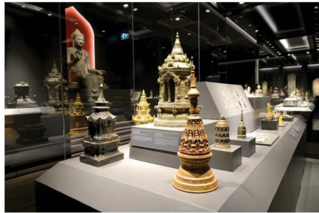
Praphat Phiphittaphan Building, National Museum Bangkok อาคารประไพพิพิธภัณฑสถานแห่งชาติพระนคร

The Department of Fine Arts, under the Ministry of Culture, with its mission to manage the nation's art and cultural heritage, has set forth a