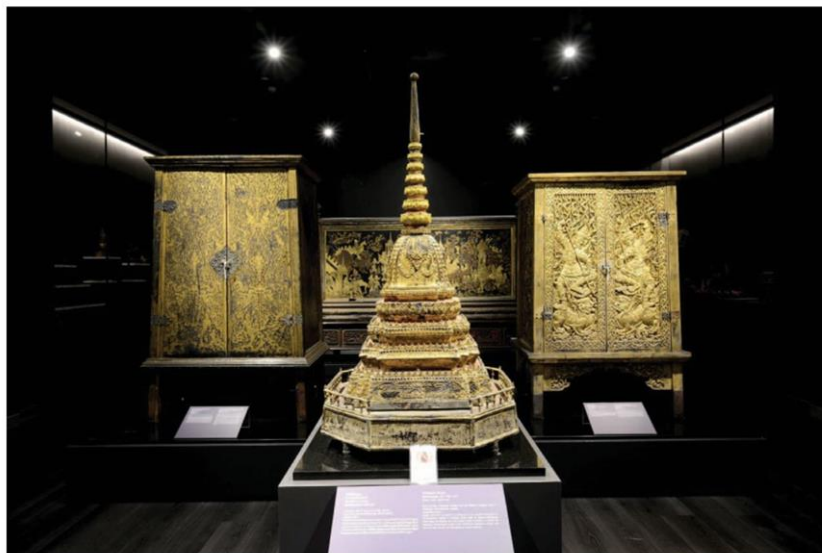
Imitated Stupa, Rattanakosin Art at National Museum Bangkok เจดีย์จำลอง ศิลปะรัตนโกสินทร์ ณ พิพิธภัณฑ์สถานแห่งชาติ พระนคร

In celebration of Thai Museum Day 2021, the Department of Fine Arts is organising MUSEUM EXPO 2021: Recover Together Step Forward activity, with the objective of connecting the museum network to the public. This will allow the museums to engage with online visitors through their specific messages, affirming the new-gen notion of endless boundary learning. The collaboration of 27 museums is available for visits at