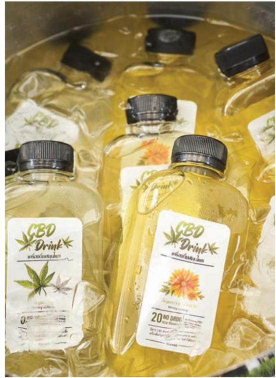
เลิกกินยาเป็นอาหาร สมุนไพรไทยและอาหารไทยสามารถ เป็นจุดแข็งและจุดขายแข่งขันกับทุกชาติในโลกได้อย่าง ชัดเจนที่สุด.

ดังนั้น ถ้าทุกฝ่ายจับมือกันผลักดันโครงการทั้งหมด ต่อยอดจากภูมิปัญญาและสรรพคุณการรักษาโรคตาม เทรนด์ใหม่ของคนทั่วโลก แนวคิดเรื่องการกินอาหารเป็นยา