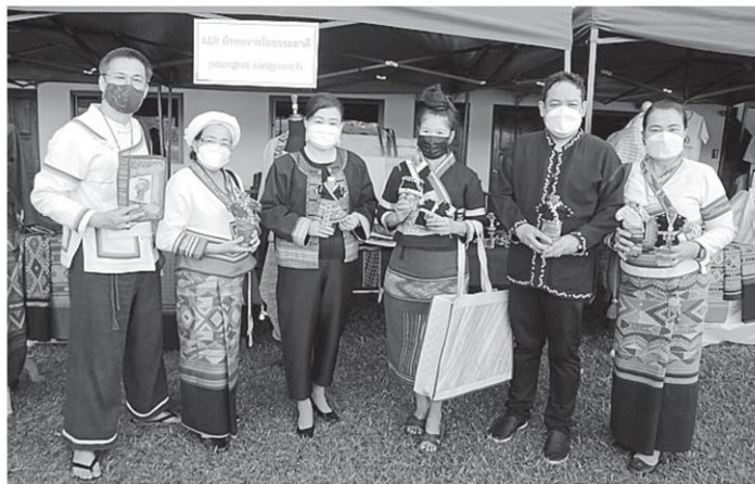
ยูฟา ทวีวัฒนะกิจบวร ปลัดกระทรวงวัฒนธรรม ตรวจเยี่ยม “ตลาดนัดผ้าทอไทลื้อ และของดีเมืองเชียงของ” โดยมี พิสันต์ จันทร์ศิลป์ วัฒนธรรมจังหวัดเชียงราย ให้การต้อนรับ ที่โรงแรมน้ำโจริเวอร์ไซด์ จ.เชียงราย.