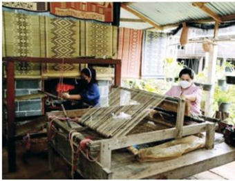
กลุ่มสตรีทอเสื่อ