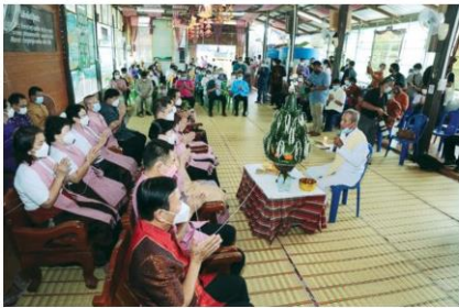
พิธีบายศรีสู่ขวัญจากปราชญ์ท้องถิ่น