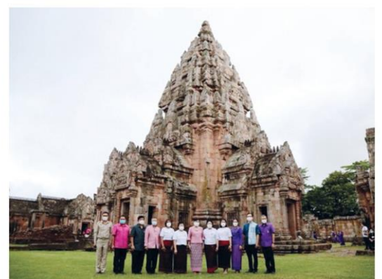
ปราสาทพนมรุ้ง