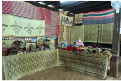
ฝ้าย้อมดินพินปี