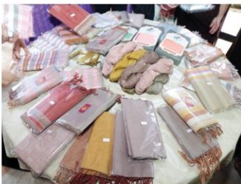
ผ้าทอบ้านโคกเมือง