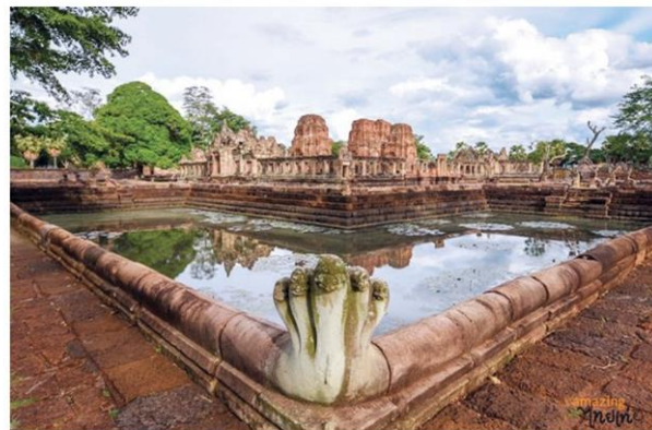
ปราสาทเมืองต่ำ