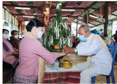
ปราชญ์อิต ๑๒ ของบ้านโคกเมือง