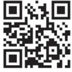
ชมคลิปวิดีโอ