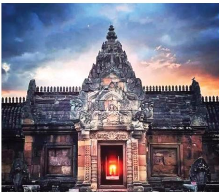
ดวงอาทิตย์ลอดช่องประตูปราสาท