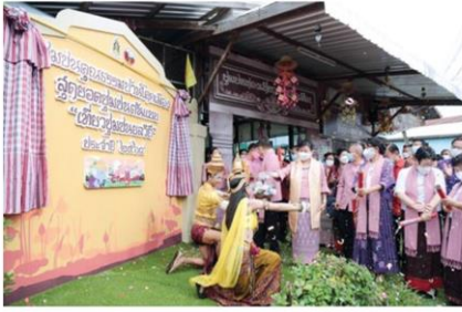
พิธีเปิดชุมชนคุณธรรมบ้านโคกเมือง

คอลัมน์: ภูมิบ้าน ภูมิเมือง: 'บ้านโคกเมือง' ภูมิถิ่นบารายปราสาทเมืองต่ำพื้นที่