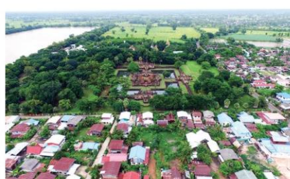
ชุมชนบ้านโคกเมือง

ทำให้ชุมชนได้รับรางวัลการประกวดหมู่บ้าน OVC (OTOP VILLAGE CHAMPION) ปี ๒๕๕๐ รางวัลหมู่บ้านท่องเที่ยวเชิงวัฒนธรรม ปี ๒๕๕๑ รางวัลอุตสาหกรรมการท่องเที่ยว ปี ๒๕๕๑ และได้รับมาตรฐานโฮมสเตย์ไทย จนบริการการท่องเที่ยวในชุมชนได้หลายรูปแบบ เช่น การทัศนศึกษาเรียนรู้จากโบราณสถาน การปั่นจักรยานชมวิถีชุมชน การเดินป่าที่เขาสายบัว การปฏิบัติธรรมนั่งสมาธิวัดสนากรรมฐานที่วัดป่า การศึกษาทดลองทำแปลงปลูกผัก ทำนา สวนเกษตรอินทรีย์ การฝึกหัด