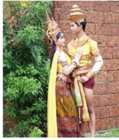
การแต่งกายจากปราสาทเมืองต่ำ