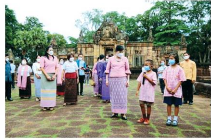
มัดคุเทศก์น้อยนำชมปราสาทเมืองต่ำ