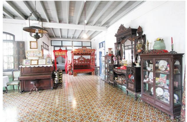
บ้านชินประชา บ้านสไตล์ชิโน-โปรตุกิส รุ่นแรก