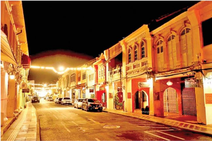
เมืองเก่าภูเก็ตยามราตรี