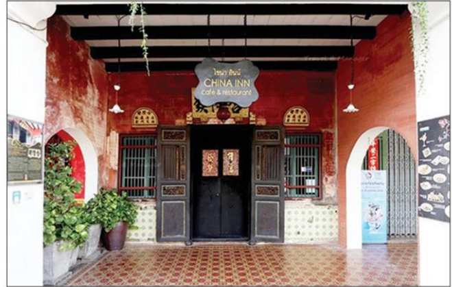
อาคารซิโน อินน์