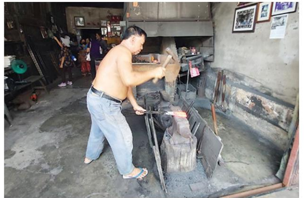
บ้านตีเหล็กแบบโบราณแหล่งสุดท้ายในเมืองเก่าภูเก็ต

มนต์เสน่ห์ของอาคารเก่าสไตล์ชิโน-ยูโรเปียน อันสวยงามสุดคลาสสิก ที่มีทั้งอาคารที่ตกแต่งใหม่อย่างสวยงามและอาคารที่คงบรรยากาศแบบเก่าแก่ดั้งเดิมดูสวยงามเป็นธรรมชาติ