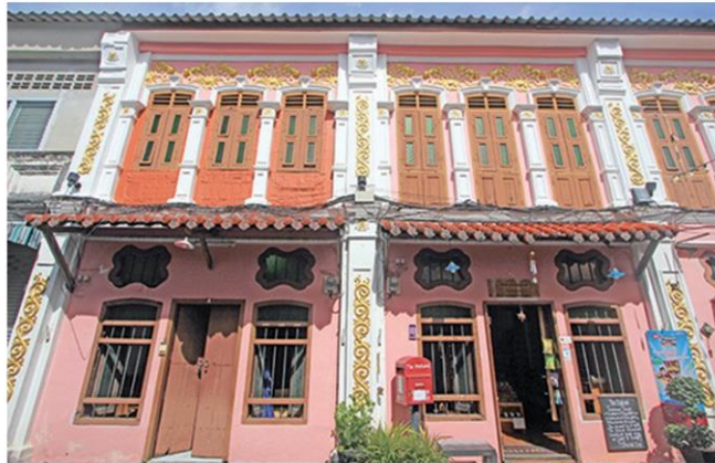
ลวดลายสีถิ่นอันชวนมองของตึกเก่าสไตล์ชิโน-โปรตุกีส

รางวัลยอดเยี่ยมในครั้งล่าสุด (ครั้งที่ 13 ปี 2563) สาขาแหล่งท่องเที่ยวชุมชน นับเป็นอีกหนึ่งความสำเร็จของชุมชนแห่งนี้