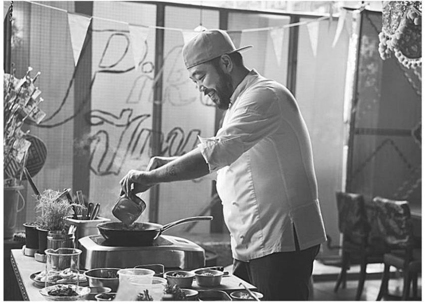
ชาย นครชัย

ด้าน “นายชาย นครชัย” อธิบดีกรมส่งเสริมวัฒนธรรม เปิดเผยว่า “ในปี 2565 นี้จะเป็นการขับเคลื่อนงานวัฒนธรรมตามนโยบายภาครัฐบาล 5F ซึ่ง Food ก็เป็นหนึ่งในห้า นั่น เราจึงมีแนวคิดในการเพิ่มคุณค่าและมูลค่าทางวัฒนธรรมสินค้า และวัตถุดิบสมุนไพรพื้นถิ่นของชุมชน ซึ่งล้วน