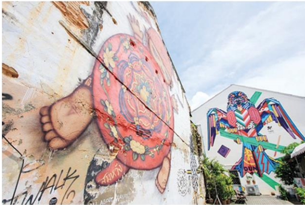
สตรีทอาร์ต มุมถ่ายรูปยอดนิยมในเมืองเก่าภูเก็ต

หัวข้อข่าว: 'เมืองเก่าภูเก็ต' ชุมชนไม่ธรรมดาดีกรีรางวัลกินรีเดินทางสู่มรดกโลก