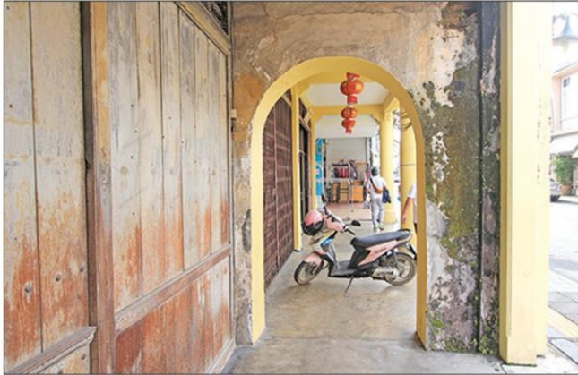
ห้องคาสี ทางเดินสาธารณะหลบแดด-ฝน

หัวข้อข่าว: 'เมืองเก่าภูเก็ต' ชุมชนไม่ธรรมดาตึกฝรั่งวางวิลกินรีเดินหน้าสู่มรดกโลก