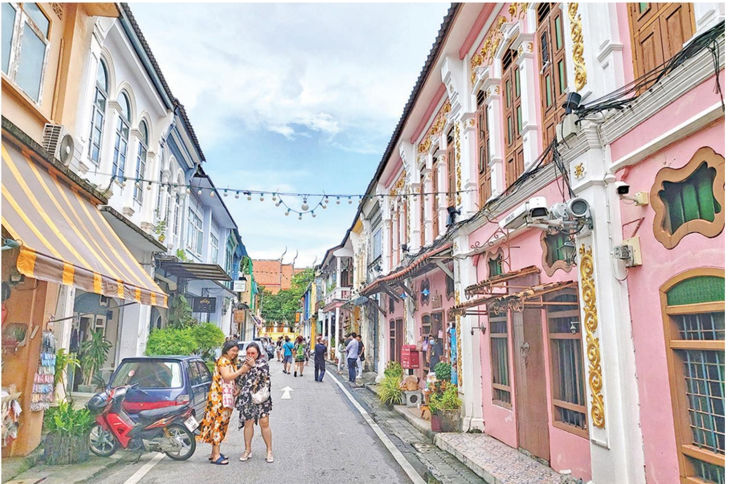
ชอยรมณีย์ที่มีอาคารสวยทั้งซอย

“ภูเก็ต” ไข่มุกอันดามัน วันนี้กำลังไปได้สวย กับโครงการ “ภูเก็ต แซนด์ บ็อกซ์” แถมล่าสุดยังได้ “รัสเซลล์ โครว์” (Russell Crowe) พระเอกคนดัง นักรบแกลดิเอเตอร์ ร่วมโปรโมตภูเก็ตให้อีกแรง (รวมถึงสถานที่อื่นๆ ในเมืองไทย) หลังเดินทางเข้ามาถ่ายทำภาพยนตร์เรื่องใหม่ในเมืองไทย