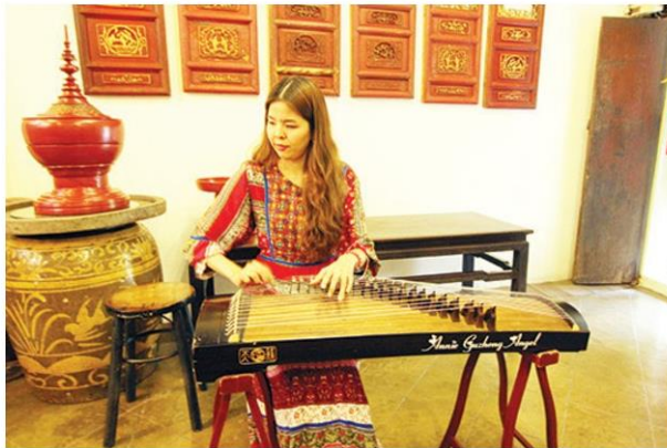
"คุณแอนนี่" นางฟ้าภูเก็ต