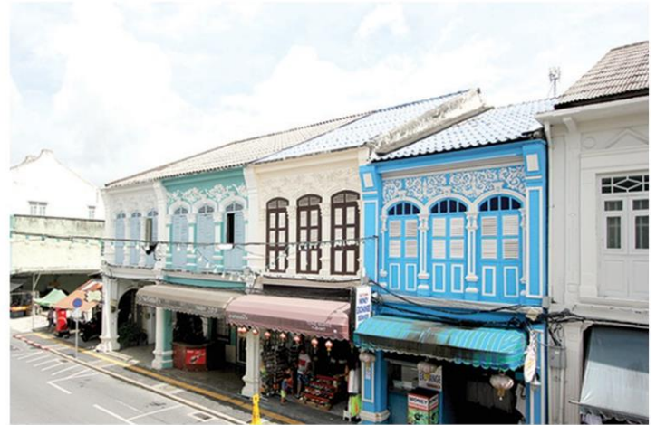
อาคารซิโน-โปรตุกีสที่มีคนเรียกขานใหม่ว่า "ซิโน-ยูโรเปียน"

ย่านเมืองเก่าภูเก็ตราวปี พ.ศ.2446 ที่ปัจจุบันยังหลงเหลือ "บ้านจีนประชา" ซึ่งเป็นอาคารสไตล์ซิโน-โปรตุกีสแบบดั้งเดิมที่ยังรักษาสภาพไว้ได้ดีมากๆ ให้ผู้สนใจได้เที่ยวชมกัน