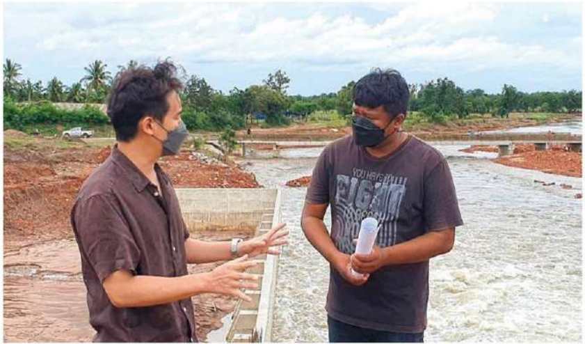
ลงพื้นที่ - นายพิทักษ์ ลิมเจริญรัตน์ หัวหน้าพรรคก้าวไกล ติดตามสถานการณ์การระบายน้ำบริเวณอ่างเก็บน้ำลำเชียงไกรตอนล่าง อ.โนนไทย จ.นครราชสีมา เพื่อเก็บข้อมูลความเดือดร้อนของประชาชนที่ได้รับผลกระทบจากน้ำท่วมในหลายพื้นที่ เมื่อวันที่ 18 ตุลาคม

ปาซุ” ทำให้มีฝนตกหนักในหลายพื้นที่ ล่าสุดบริเวณพื้นที่ท้ายอ่างเก็บน้ำลำตะคอง ลุ่มน้ำลำตะคอง ระดับน้ำในลำน้ำยังเพิ่มสูงขึ้น ส่งผลให้มวลน้ำก้อนใหญ่ไหลหลากและเอ่อล้นตลิ่งเข้าท่วมบ้านเรือนและเส้นทางสัญจรต่างๆ โดยโครงการชลประทานนครราชสีมาได้ออกประกาศด่วนที่สุดให้ประชาชนเฝ้าระวัง และติดตามสถานการณ์น้ำที่อยู่ในพื้นที่ลุ่มต่ำตามเส้นทางน้ำ ได้แก่ อ.สีคิ้ว อ.สูงเนิน อ.ขามทะเลสอ อ.เมืองนครราชสีมา และ อ.เฉลิมพระเกียรติ