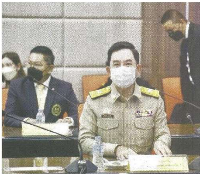
เชิดชู คณะกรรมการวัฒนธรรมแห่งชาติ ในสังกัดกระทรวงวัฒนธรรม โดยมี อิทธิพล คุณปลื้ม เป็นรมว. มีมติเห็นชอบให้บุคลากรในวงการกีฬามวยไทยเป็น "ศิลปินแห่งชาติ" พร้อมมอบหมายให้กระทรวงการท่องเที่ยวและกีฬา ปรับสวัสดิการและประโยชน์ตอบแทนจาก "กองทุนกีฬามวย" เช่นศิลปินแห่งชาติ

1. มอบหมายให้กรมส่งเสริมวัฒนธรรม กระทรวงวัฒนธรรม ยกย่องเชิดชูเกียรติบุคคลในวงการมวยไทย ตามพระราชบัญญัติวัฒนธรรมแห่งชาติ พุทธศักราช 2553 มาตรา 28 (3) บุคคลที่มีผลงานดีเด่นทางวัฒนธรรมและพระราชบัญญัติการส่งเสริมและรักษามรดกภูมิปัญญาทางวัฒนธรรม พ.ศ.2559 มาตรา 4 (6) ในการยกย่องบุคคลที่มีบุคคลดีเด่นทางวัฒนธรรม สาขากีฬา ศิลปะการต่อสู้ป้องกันตัวและการละเล่น เช่นมวยไทย