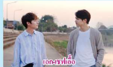
เอก-เซฟเอื้อ

มีให้กับ 'เอก' ในซีรีส์ "สร้างร้อนเริ่ฟรัก BITEME" ทางช่อง One 31 และ VIU หนุ่ม 'มาร์ค' ทิวช จ้างอดกูด ที่รับบท เอก