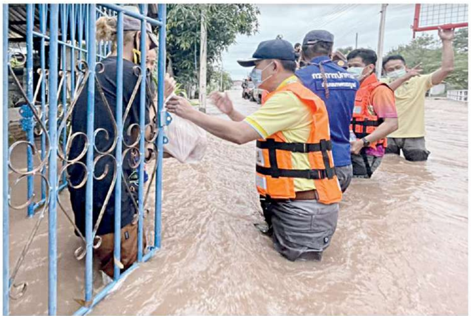
▲ ทะลัด!...จนท.ป้องกันและบรรเทาสาธารณภัย นำสิ่งของเครื่องใช้จำเป็นไปมอบให้ความช่วยเหลือประชาชนประสบอุทกภัยในพื้นที่ 9 อำเภอของ จ.ชัยภูมิ สร้างความดีใจให้กับผู้ประสบภัยเป็นอย่างมาก

จ.พระนครศรีอยุธยา น้ำจากแม่น้ำเจ้าพระยาเอ่อล้นตลิ่งเข้าท่วมในพื้นที่ 10 อำเภอ ผักไห่ เสนา บางบาล พระนครศรีอยุธยา บางไทร บางปะอิน มหาราช นครหลวง บางปะหัน และบางซ้าย ปัจจุบันมีน้ำท่วมขังในพื้นที่ลุ่มต่ำแม่น้ำเจ้าพระยา แม่น้ำน้อย คลองโพงผาง และคลองบางบาล นอกคันกันน้ำ จ.พทุมธานี น้ำจากแม่น้ำเจ้าพระยาเอ่อล้นตลิ่งเข้าท่วมในพื้นที่ริมแม่น้ำ 2 อำเภอ เมือง และสามโคก ปัจจุบันมีน้ำท่วมขังในพื้นที่ลุ่มต่ำแม่น้ำเจ้าพระยาอยู่รอบคันกันน้ำ