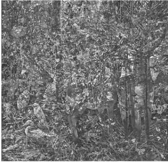
ผลงานสื่อผสมบนผ้าใบ "ดินแดงแห่งความสุข" สื่อแนวคิดอนุรักษนิยมชนชาติ