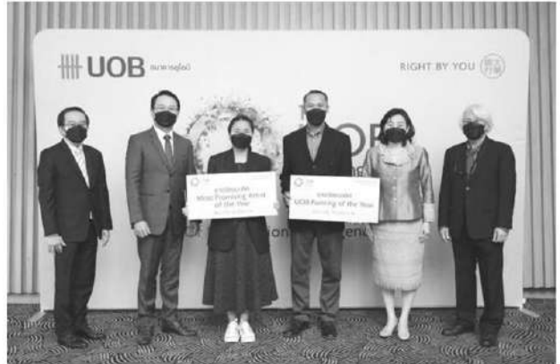
งานประกาศผลรางวัลจิตรกรรมยูโอบี ครั้งที่ 12

เพชรเกษม ระหว่างวันที่ 1-31 มี.ค.2565 เข้าชมฟรี การประกวดจิตรกรรมยูโอบี ประเทศไทย ประจำปี 2564 ธนาคารยูโอบีมีมุ่งสนับสนุน ศิลปินทรงคุณค่าและเป็นหนึ่งในการประกวด