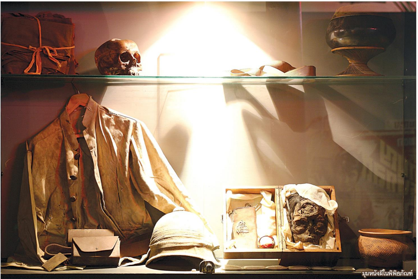
มุมหนังผีในพิพิธภัณฑ์