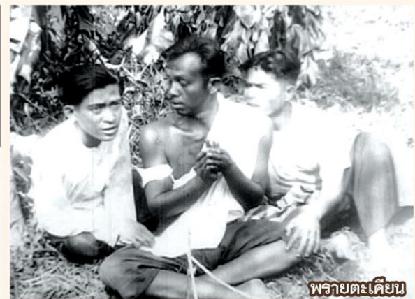
พรายตะเคียน