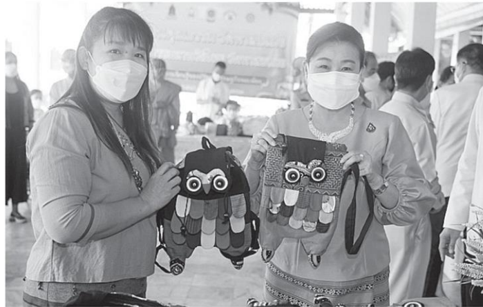
ยูฟา ทวีวัฒนะกิจบวร ปลัดกระทรวงวัฒนธรรม เยี่ยมชมนิทรรศการของชุมชนคุณธรรมฯ วัดป่าบุก ชุมชนคุณธรรมฯ วัดท่าสเบเมย และเยี่ยมชมผลิตภัณฑ์วัฒนธรรมไทย CPOT ที่วัดพระธาตุหริภุญชัยวรมหาวิหาร จ.ลำพูน.