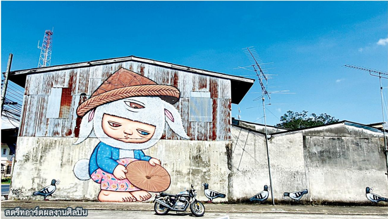
สตรีทอาร์ตผลงานศิลปิน