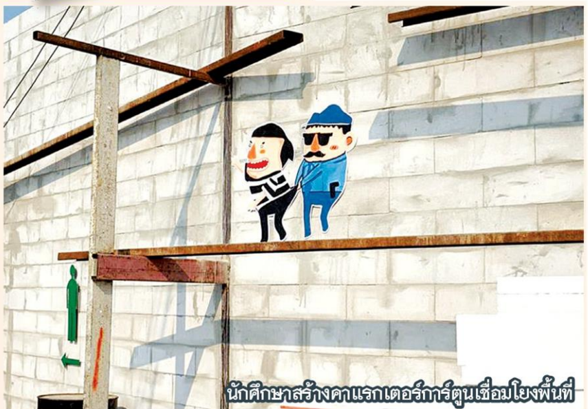
นักศึกษาสร้างคาแรกเตอร์การ์ตูนเชื่อมโยงพื้นที่

กำแพงก็ไม่ได้อยู่เฉพาะพื้นที่เหล่านี้ ขยายต่อเนื่องไปบนวัตถุสร้างสรรค์ศิลปะได้หลากหลาย ที่ผ่านมาจากการศึกษาในวิชาองค์ประกอบศิลป์ นักศึกษาก็ได้สร้างสรรค์ศิลปะกับชุมชนซึ่งก็เป็นสตรีทอาร์ตอย่างหนึ่ง การทำงานศิลปะมีปฏิสัมพันธ์กับบริบทชุมชน ดังเช่นถ้าชุมชนเป็นชุมชนริมน้ำ หรือย่านค้าขาย ฯลฯ สตรีทอาร์ตจะเป็นอีก