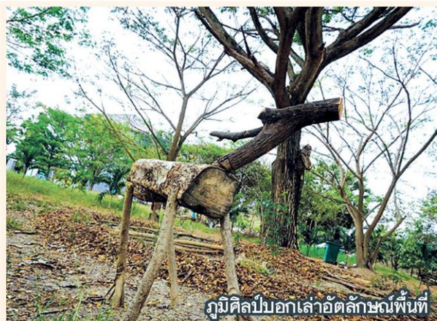
ภูมิศิลป์บอกเล่าอัตลักษณ์พื้นที่

ส่วนหนึ่งที่จะถ่ายทอด นำเสนออัตลักษณ์ บอกเล่าเรื่องราวของชุมชน “ศิลปะที่สร้างสรรค์นอกจากสร้างแรงดึงดูดทำให้พื้นที่หรือชุมชนเป็นที่รู้จัก สตรีทอาร์ตยังช่วยปรับเสริมภูมิทัศน์ให้พื้นที่เป็นที่สนใจ สะดุดตา เกิดการดูแลร่วมกันของชุมชน โดยศิลปะเป็นอีกส่วนหนึ่งที่ร่วมเชื่อมโยง ซึ่งศิลปะกับชุมชนในครั้งนั้นสร้างสรรค์ขึ้นในพื้นที่ศาลายา โดยมีการพูดคุยแลกเปลี่ยนมุมมองกับนักศึกษา คณาจารย์ โดยกราฟิตี้เป็นหัวข้อหนึ่งที่นำมาสร้างสรรค์ขณะเดียวกัน มี งานภูมิศิลป์ อินสตอลเรชัน มือปาร์ต ฯลฯ”