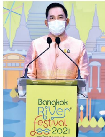
อิทธิพล คุณปลื้ม รัฐมนตรีว่าการกระทรวงวัฒนธรรม

นายอิทธิพล คุณปลื้ม รัฐมนตรีว่าการกระทรวงวัฒนธรรม กล่าวว่า “ในนามของกระทรวงวัฒนธรรม รู้สึกเป็นเกียรติอย่างยิ่งที่ได้มาร่วมงานแถลงข่าว “Bangkok River Festival 2021 สายน้ำแห่งวัฒนธรรมไทย” ครั้งนี้ ซึ่งสอดคล้องกับนโยบายของภาครัฐในการเปิดประเทศต้อนรับนักท่องเที่ยว เป็นงานที่นำเสนอเทศกาลประเพณีอันดีงาม และบอกเล่าวัฒนธรรมไทยไปทั่วโลก สะท้อนวิถีชุมชนริมสายน้ำที่เป็นบ่อเกิดแห่งวัฒนธรรมอันหลากหลาย ซึ่งเป็นเอกลักษณ์ของประเทศไทย นอกจากนี้ถือเป็นการสนับสนุนนโยบายรัฐบาลที่มุ่งผลักดันการใช้ “Soft Power” ความเป็นไทยและอุตสาหกรรมสร้างสรรค์ (Creative Economy) โดยเฉพาะการท่องเที่ยวเชิงวัฒนธรรม และนโยบายของกระทรวงวัฒนธรรมในการส่งเสริม