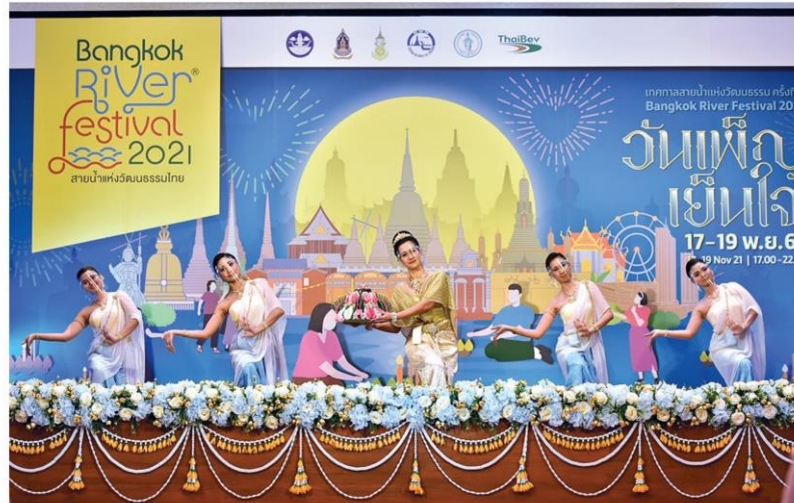
การแสดงชุดพิเศษ วัฒนธรรมแห่งสายธาร