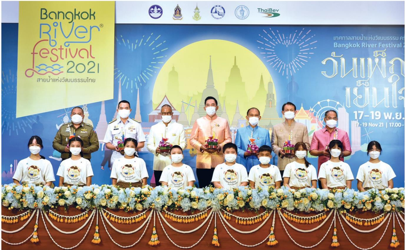
ไทยเบฟ แดลงข่าวการจัดงาน “Bangkok River Festival 2021 สายน้ำแห่งวัฒนธรรมไทย” ครั้งที่ 7