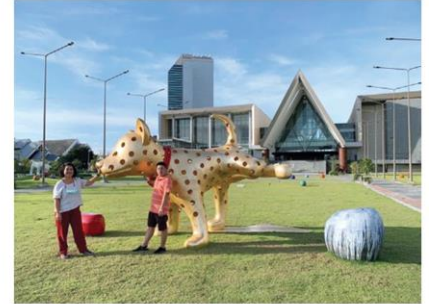
ประติมากรรมของ วศินบุรี สุพานิชวรภาชน์