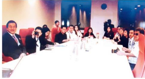
การศึกษาดูงานที่หอศิลป์แห่งชาติสิงคโปร์

คอลัมน์: ภูมิบ้าน ภูมิเมือง: 'หอศิลป์แห่งชาติ' ภูมิศิลปะร่วมสมัยแลนด์มาร์คแห่งใหม่