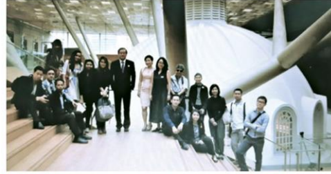
คนงานจากกระทรวงวัฒนธรรมดูงานหอศิลป์แห่งชาติสิงคโปร์