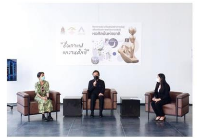
กิจกรรมติ้มนกาแฟผลงานศิลปะ