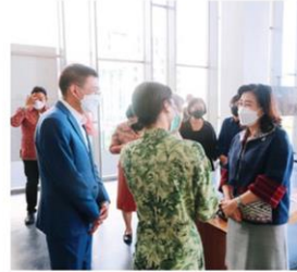
พบปะกับศิลปิน