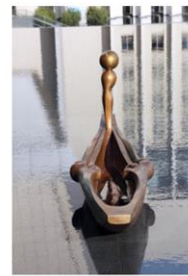
ประติมากรรมของ ลูกปลิว จันทร์พุดชา