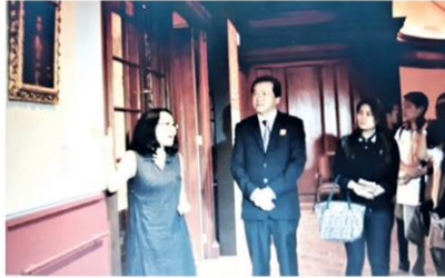
ภาพเขียน ร.๓ ที่ยืมไปแสดง