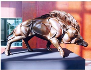
ประติมากรรมของ ชิน ประสงค์