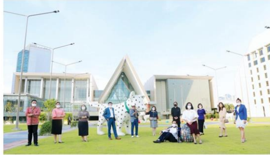
หอศิลป์แห่งชาติแห่งใหม่