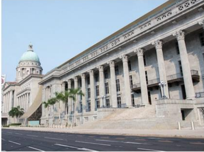
หอศิลป์แห่งชาติสิงคโปร์