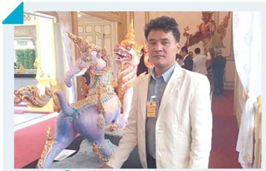
ช่างปูนปั้นสดเมืองเพชร ผู้ถวายงานปั้น สัตว์หิมพานต์ ประดับพระเมรุมาศฯ >8