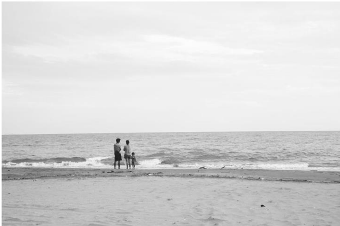
ครอบครัวสุขสันต์ริมหาดประแส