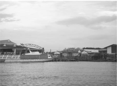
ศาลเจ้าริมน้ำประแส