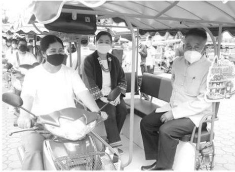
สามล้อฟ่งพาเที่ยวได้เกือบทุกที่