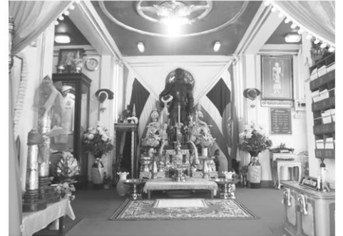
ศาลกรมหลวงชุมพร