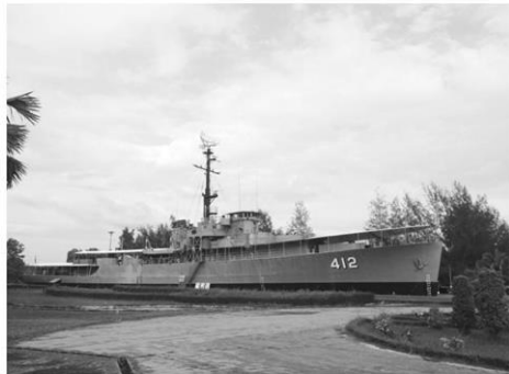
อนุสรณ์เรือรบหลวงประแส