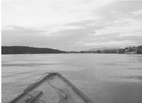
ล่องแม่น้ำประแสชมวิวธรรมชาติ