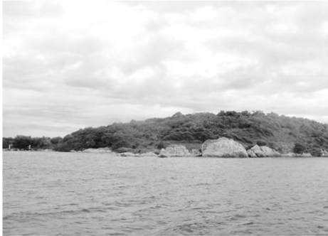
เกาะมันใน แหล่งอนุรักษ์เต่าทะเล