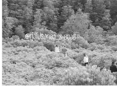
เหลียงอร่าม ฟุ่งปรังทอง