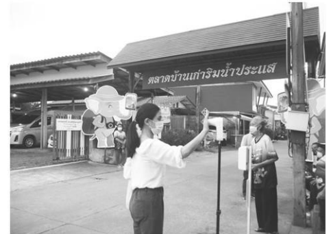
จุดคัดกรองก่อนเข้าชุมชน

ยุ่งยาก นอกจากนี้ยังต้องมีการติดตามอย่างต่อเนื่อง และคาดว่ารายได้จากการท่องเที่ยวจะเพิ่มขึ้น 10% จากปี 2562 ก่อนที่โควิด-19 จะระบาด” ปลัด ว.ภล่าว