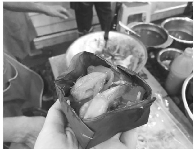
เส้นใหญ่ผัดเปรี้ยวหวาน อร่อยแค่ 10 บาท

จะให้ครบสักต้องนั่งสามล้อฟ่ง 1 คันนั่งได้ 4 คน ไม่รอช้า เราใช้บริการทันที สูงคนขับก็สวมหน้ากากอนามัยเรียบร้อย แต่งกายสุภาพ นั่งรถชมวิวน้ำประแส ภูเขาไปเรื่อยๆ ก็มาถึงที่วัดตะเคียนงาม ต้นไม้สูงใหญ่เด่นตระหง่านอยู่ด้านในวัดคือต้นตะเคียนคู่ เป็นรุกขมรดกของแผ่นดินได้รับพระบารมี มีอายุกว่า 400 ปี ชาวบ้านมักเรียกว่า