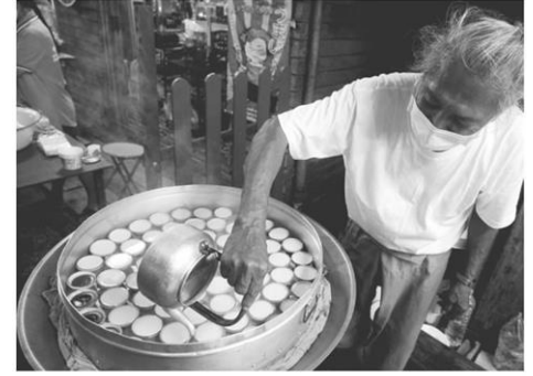
ขนมถ้วย หน้าตาน่ากิน รสชาติดั้งเดิมของชุมชน