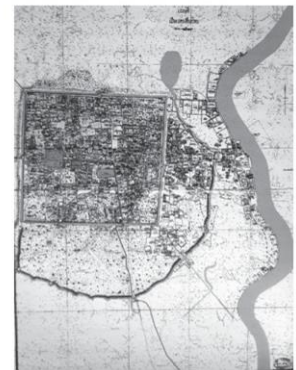
ผังเมืองเชียงใหม่