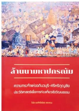
งานวิจัยล้านนามหาปกรณัม