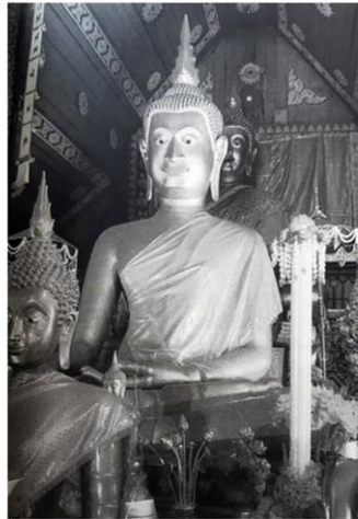
พระเจ้าช้างคัม วัดศรีเกิด