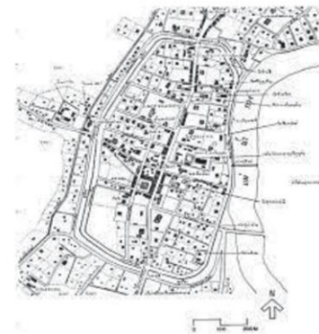
เมืองลำพูน