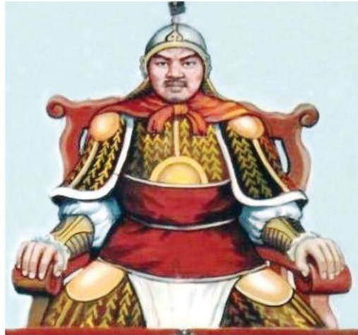
หนงจ้อเกา หรือขุนเจือง