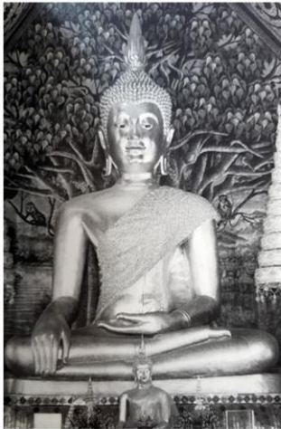
พระเจ้าแก้วตืดวัดสวนดอก