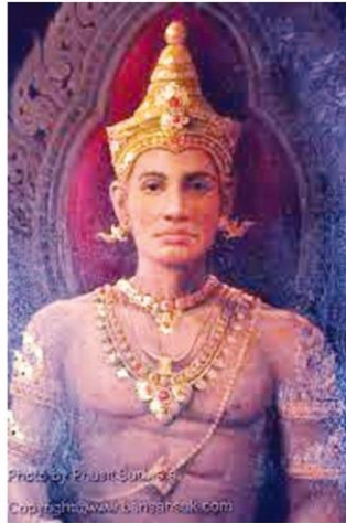
พระยามังรายหลวง

คอลัมน์: ภูมิบ้าน ภูมิบ้าน: 'ล้านนามหาปกรณัม' ภูมิรัฐใหม่อภิชนบุรี-ศรีทริภุญชัย