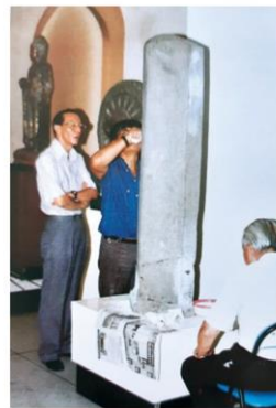
จารึกรามพล