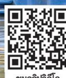
ชมคลิปวิดีโอ