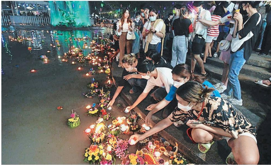
▲ แห่ลอยกระทง วัยรุ่นหนุ่มสาวแห่ร่วมงานลอยกระทงที่สะพานน้ำหน้าหอประชุมใหญ่ ม.เกษตรศาสตร์ บางเขน กรุงเทพฯ จนแน่นขนัด เจ้าหน้าที่ต้องปิดประตูรอให้คนที่ลอยกระทงเสร็จแล้วออกไปก่อน ถึงให้คนที่รอคิวเข้าไปลอยกระทง.

พุทธศักราช 2564 “ลอยกระทงวิถีใหม่” สืบสานประเพณีไทย 1 ครอบครัว 1 กระทง รักษาาระยะห่าง สวมหน้ากากอนามัย ปลอดภัย ปลอดภัย” โดยมีคณะรัฐมนตรี (ครม.) อาทิ พล.อ.ประวิตร วงษ์สุวรรณ รองนายกรัฐมนตรี นายวิษณุ เครืองาม รองนายกรัฐมนตรี นายจุรินทร์ ลักษณวิศิษฏ์ รองนายกรัฐมนตรี และ รมว.พาณิชย์ นายสุพัฒนพงษ์ พันธ์มีเชาว์ รองนายกรัฐมนตรี และ รมว.พลังงาน พล.อ.อนุพงษ์ เผ่าจินดา รมว.มหาดไทย นายศักดิ์สยาม ชิดชอบ รมว.คมนาคม นายสุชาติ ชมกลิ่น รมว.แรงงาน นายอิทธิพล คุณปลื้ม รมว.วัฒนธรรม นายอิทธิชัย รัตน์ เศรษฐฐุ รมช.คมนาคม และคู่สมรสข้าราชการการเมืองผู้บริหาร ข้าราชการ และเจ้าหน้าที่ ในทำเนียบรัฐบาล แต่งกายด้วยชุดผ้าไทยเข้าร่วมงานอย่างพร้อมเพรียง