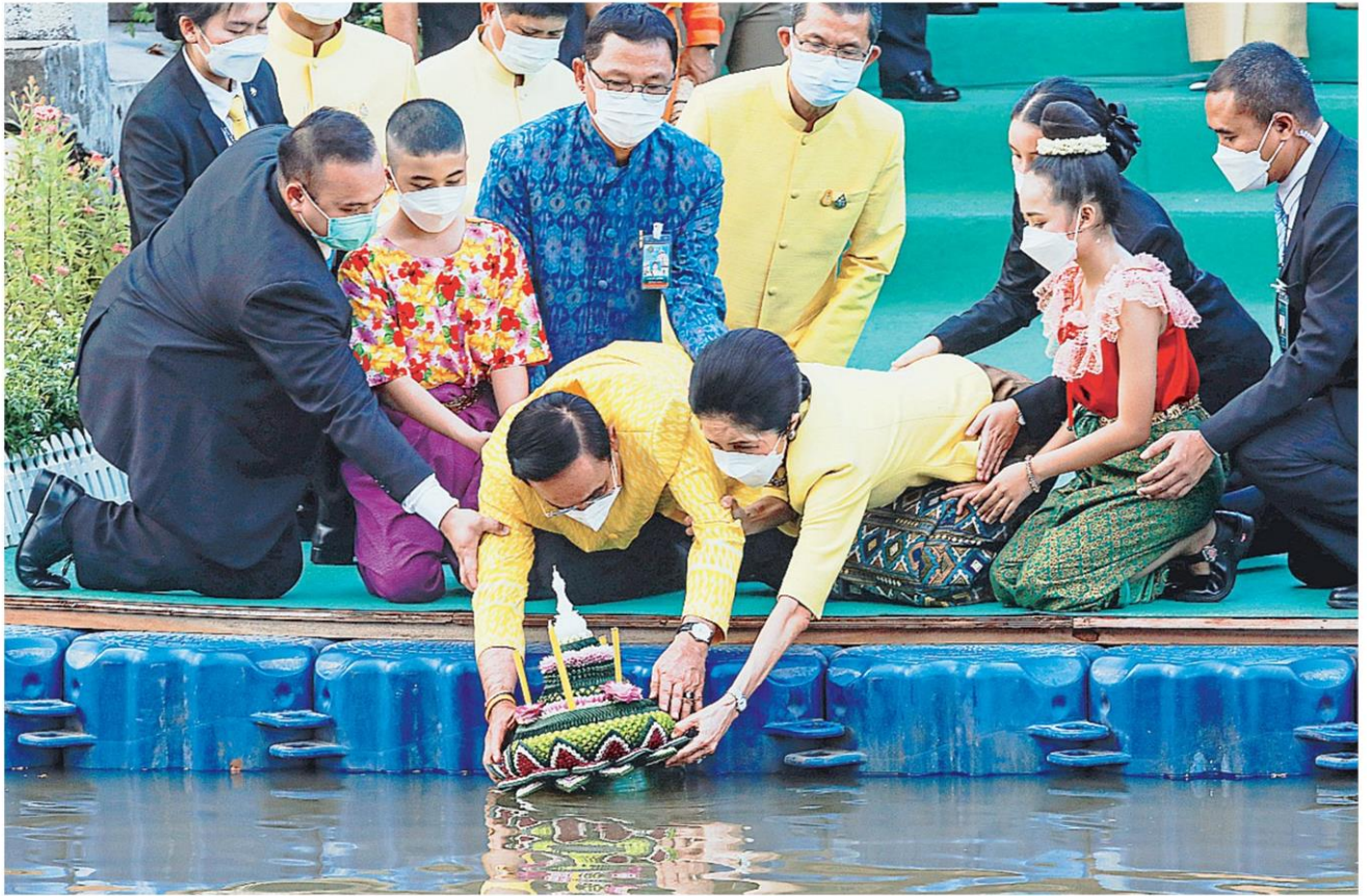
▲ ขมาแม่คงคา พล.อ.ประยุทธ์ จันทร์โอชา นายกข ลอยกระทงร่วมกับนางนราพร จันทร์โอชา ภริยา ตามนโยบายลอยกระทงวิถีใหม่ 1 ครอบครั้ว 1 กระทง ลดปริมาณขยะ ป้องกันการระบาดของโควิด ที่คลองผดุงกรุงเกษม ช่างทำเนียบฯ พร้อมอธิฐานขอให้บ้านเมืองปลอดภัย และกล่าวคาถาขอขมาลาโทษพระแม่คงคา.