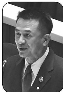
นพ.ชลน่าน ศรีแก้ว

● เล่นใหญ่ “หมอชลน่าน ศรีแก้ว” สวมบทว่าที่ผู้นำฝ่ายค้านโอเคบิ๊กตุ๋ “ข้อเสนอของนายกฯ เป็นในลักษณะของการไม่ถึง โดยให้กระทรวงคมนาคมใช้รถขนส่งสาธารณะ และให้ทหารนำรถทหารทำการขนส่งแทน วิถีคิดแบบนี้ทำให้ประเทศไทยบ้านเมืองทางออกไม่ได้ เหมือนเป็นการช่วยยื้อให้เขาเพิ่มมาตรการกดดัน ในฐานะ ส.ส. และหัวหน้าพรรคเพื่อไทย ขอกราบเรียนไปยังนายกฯ เวลาพูดอะไรขอให้พูดออกมาจากมันสมองของผู้นำประเทศบ้าง ขออนุญาตพูดแรง ขอให้ใส่ใจพี่น้องประชาชนบ้าง” จัดหนักชูจะ