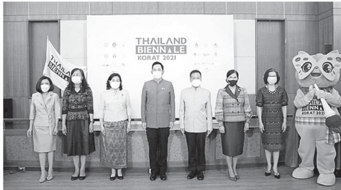
อิทธิพล คุณปลื้ม รมว.วัฒนธรรม และ ชูศักดิ์ ชุนเกาะ รองผู้ว่าราชการจังหวัดนครราชสีมา แถลงข่าวการจัดงาน โครงการการแสดงศิลปกรรมนานาชาติ Thailand Biennale, Korat 2021 โดยจะจัดขึ้นระหว่างวันที่ 18 ธ.ค. 64 จนถึง 31 มี.ค.65 ที่ จ.นครราชสีมา เมื่อก่อน.