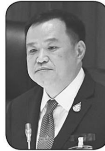
อนุนทิน ชาญวีรกุล

● ดรามาอีกจนได้! สังคมไทยยุคนี้ช่างอ่อนไหวเสียจริง ท่องแต่คำว่าลี้คมสงเสรีภาพ (ของตัวเอง แต่ไม่ยกคำนึงของผู้อื่น) ไม่ต้องพูดถึงเรื่องหน้าที่ ประเด็นฉีดวัคซีนเป็นเรื่องของความสมัครใจอยู่แล้ว ไม่มีข้อกฎหมายบังคับได้ แต่อย่าลืมว่าการฉีดวัคซีนก็ถือว่าการรับผิดชอบต่อตัวเอง ครอบครัว และ