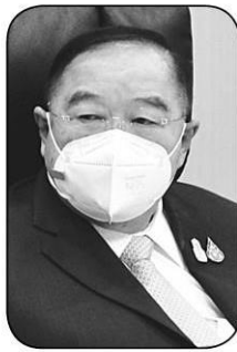
พล.อ.ประวิตร วงษ์สุวรรณ

1 ไทยโพสต์ “อิสรภาพแห่งความคิด” ลอยความขัดแย้ง! คำอธิษฐานล่วงหน้าของ “บิ๊กป้อม” ก่อนจะลอยกระทงจริงวันศุกร์นี้ ในงาน “ลอยกระทงวิถีใหม่ สืบสานประเพณีไทย 1 ครอบครัว 1 กระทง รักษาระยะห่าง สวมหน้ากากอนามัย ปลอดภัย ปลอดภัย” ซึ่ง “บิ๊กตุ๋” จะควงอาจารย์น้อง น้า ครม.และคู่สมรส รวมถึงข้าราชการการเมือง