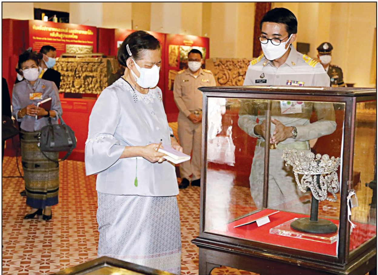
สมเด็จพระกนิษฐาธิราชเจ้า กรมสมเด็จพระเทพรัตนราชสุดาฯ สยามบรมราชกุมารี เสด็จฯ ไปในงานเฉลิมพระเกียรติพระบาทสมเด็จพระพุทธเลิศหล้านภาลัย ณ พิพิธภัณฑสถานแห่งชาติ พระนคร เขตพระนคร