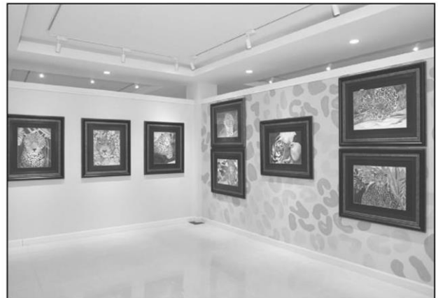
ศิลปะร่วมสมัยชุด "เสือ" แสดงพระปรีชาสามารถด้านศิลปะ