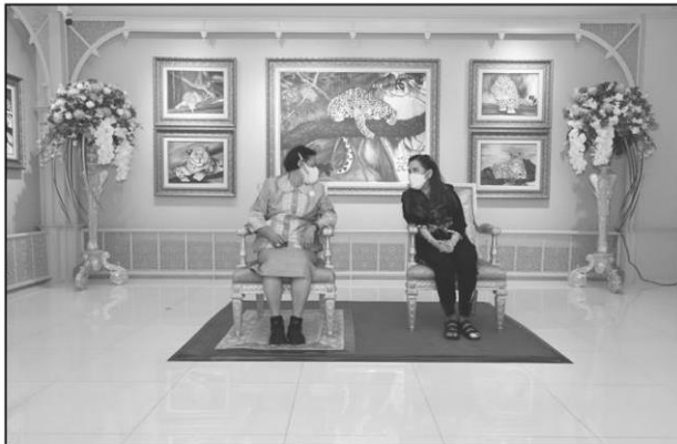
กรมสมเด็จพระเทพฯ ทรงเปิดงาน ไทยแลนด์ เบียนนาเล่ โคราช 2021