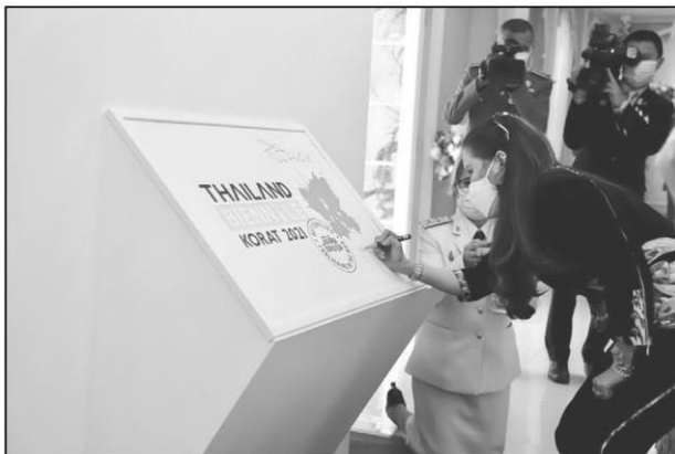
กรมพระศรีสวางควัฒนฯ ทรงมีพระปรีชาสามารถ สนพระราชหฤทัยในงานศิลปะ