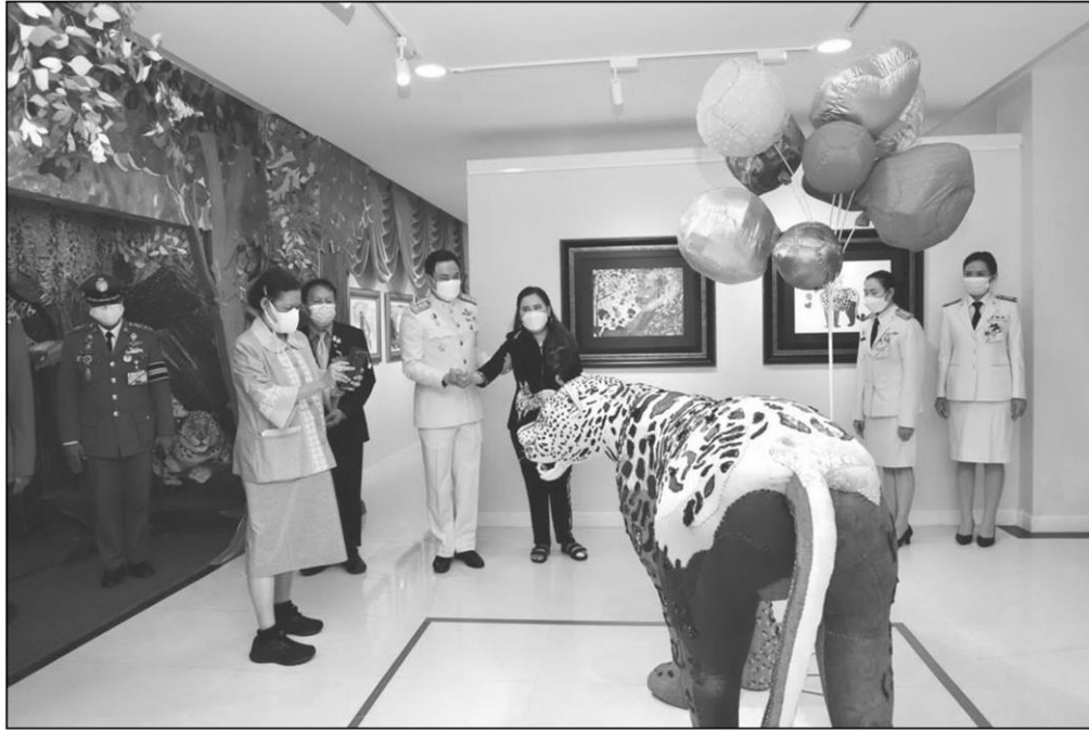
กรมสมเด็จพระเทพฯ ทอดพระเนตรประติมากรรมเลื้อยในนิทรรศการ "ลิริศิลป์"