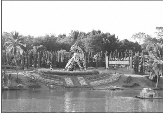
ประติมากรรม “เสือ” ณ หอศิลป์พิฆานทิพย์ อ.ปากช่อง หนึ่งในพื้นที่หลักงาน

ภูมิปัญญาท้องถิ่น ชนบประเพณีและ วิถีวัฒนธรรมของชุมชน ในรูปแบบ ของศิลปะจัดวางเฉพาะที่ นำไปสู่การ ฟื้นฟู ส่งเสริม และสร้างรายได้สู่ท้อง ถิ่นและทุกภาคส่วน ในปีนี้มีศิลปิน ชาวไทยและชาวต่างประเทศเข้าร่วม โครงการ 53 คน จาก 25 ประเทศ