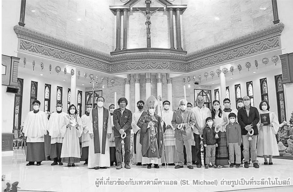
ผู้ที่เกี่ยวข้องกับเทวดามีคาแอล (St. Michael) ถ่ายรูปเป็นที่ระลึกในโบสถ์