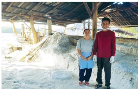
คนทำเกลือที่เหลืออยู่