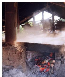
ต้มเกลือด้วยฟืน