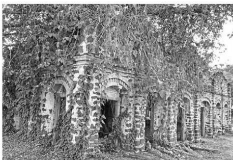
อาคารของชุมชนยุคแรกของบ้านท่าแร่ที่ยังเหลือเก็บไว้อยู่

เมื่อเช้าวันที่ 5 ธันวาคม พ.ศ.2564 บาทหลวงสังฆราชประจำสังฆมณฑลได้ทำพิธีเสกเทวดามีคาแอล (St. Michael) ที่อาสนวิหารอัครเทวดามีคาแอล ท่าแร่ ซึ่งมีประชาชนชาวคาทอลิก 1,000 กว่าคน เข้าร่วมในพิธี โดยมีการถ่ายทอดออนไลน์ เพื่อให้ชาวคริสต์ทั่วโลก