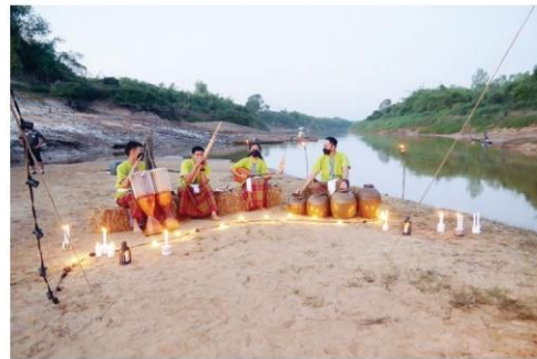
เสียงแคนบนหาดทราย