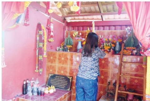
ศาลเจ้าปู่คำแดงของคนทำเกลือ