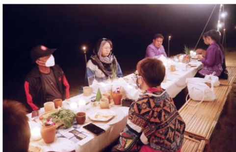
สัมผัสเมนูอาหารเพื่อการเที่ยว