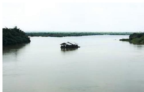
แม่น้ำสงคราม