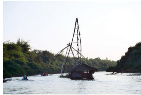
สะตู่หรือยอยักษ์จับปลา