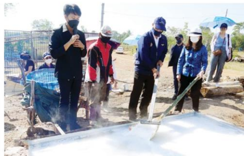
การทำเกลือโบราณ