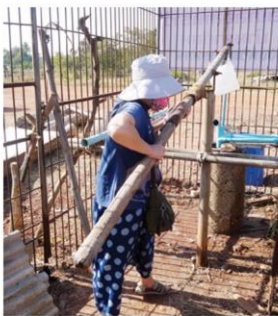
สูบน้ำเกลือใต้ดิน