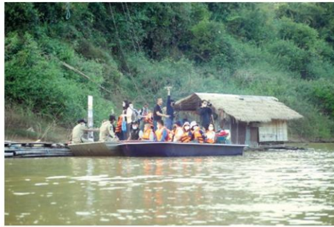
แพพักริมน้ำ

คอลัมน์: ภูมิบ้าน ภูมิเมือง: 'ลุ่มน้ำสงคราม' เส้นทางสายเกลือสินเธาว์แห่งอีสาน