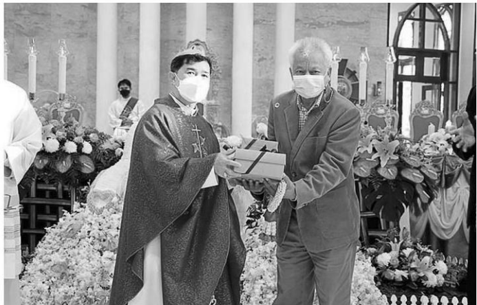
รับของที่ระลึกจากสังฆราช