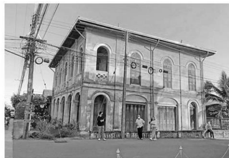
บ้านโบราณที่นักท่องเที่ยวนิยมไปถ่ายรูป ยังเหลืออยู่อีก 3-4 หลัง ที่บ้านท่าแร่