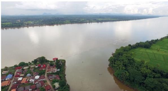
แม่น้ำสงคราม

พื้นที่ทางประวัติศาสตร์และวัฒนธรรม ให้เป็นที่รู้จักแพร่หลายในไทยและนานาชาตินั้น จึงทำให้เกิดโครงการเผยแพร่วัฒนธรรมบนเส้นทางสายเกลือใน ๓ จังหวัด ของภาคตะวันออกเฉียงเหนือ ใน สกลนคร บึงกาฬ และนครพนม ขึ้น โดยใช้แหล่งวัฒนธรรมเกลือบนแม่น้ำสงคราม ซึ่งเป็นลำน้ำสาขาหลักของแม่น้ำโขง ซึ่งเป็น ๑ ใน ๓๗ แห่งของกลุ่มน้ำสาขาของกลุ่มแม่น้ำโขง ที่แบ่งเป็นลุ่มน้ำสงครามตอนบน และลุ่มน้ำสงครามตอนล่าง มีพื้นที่ลุ่มน้ำรวมกันประมาณ ๖,๔๗๒ ตารางกิโลเมตร หรือประมาณ ๔,๐๔๕,๐๐๐ ไร่ ครอบคลุมพื้นที่ใน ๕ จังหวัด คือ สกลนคร อุตรดิตถ์ หนองคาย บึงกาฬ และนครพนม แม่น้ำสายนี้มีต้นกำเนิดจากเทือกเขา