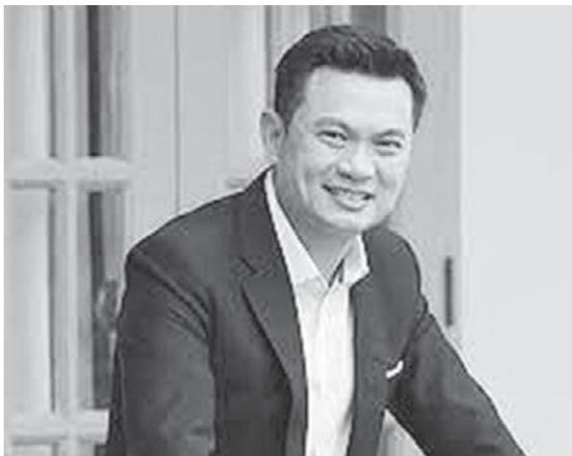
ศ.ดร.สุชัยวีร์ สุวรรณสวัสดิ์

เพราะ “พีเอ็” ได้ยื่นใบลาออกจากตำแหน่งอธิการบดี และทางสภา สจล. ก็ได้อนุมัติหนังสือลาออกแล้ว ปิดฉากการเป็นนักบริหารในตำแหน่งอธิการบดี 2 สมัย 6 ปี 7 เดือน เพื่อก้าวสู่เส้นทางใหม่ เป็นงานใหญ่ที่ทำหายุคือ “ซ่อม-สร้างกรุงเทพฯ”