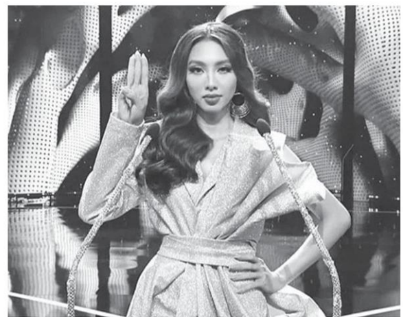
เหิงยีน ตึก ตุย เตียน

จึงได้ทำการสั่งสื่อเวียดนามมิให้นำเสนอภาพ และข่าวนางงามเวียดนามซู 3 นิ้ว ในไทยโดยเด็ดขาด รวมทั้งกระทรวงวัฒนธรรม ได้สั่งการให้นางงามเวียดนามคนที่ซู 3 นิ้ว หยุดแสดงพฤติกรรม หรือคำพูดที่อาจก่อให้เกิดผลกระทบต่อความสัมพันธ์ที่ตึงามระหว่างไทยกับเวียดนาม