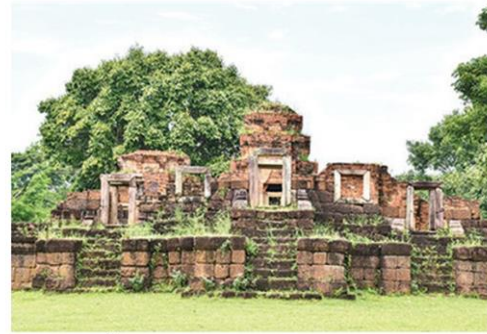
ก่อด้วยอิฐตั้งอยู่บนฐานศิลาแลง

บารายทั้ง 4 ด้านนี้ ที่มุมขอบสระสร้างเป็นรูป พญานาค 5 หัว กำลังชูคอแผ่พังพาน ด้านบนหัว พญานาคเรียบเกลี้ยงไม่มีริ้วครีหรือเครื่องประดับใดๆ