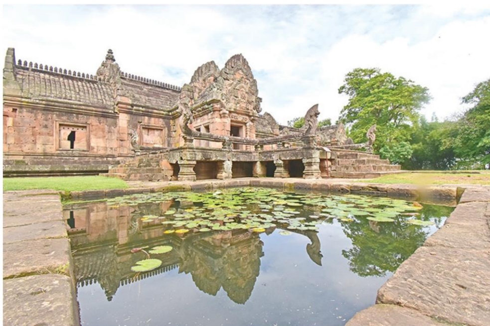
บริเวณด้านหน้าปราสาทหินพนมรุ้ง

อีกหนึ่งปราสาทที่น่าสนใจก็คือ “ ปราสาท หนองหงส์ ” ตั้งอยู่ที่ ตำบลโนนดินแดง อำเภอโนน ดินแดง เป็นโบราณสถานขนาดเล็กประกอบด้วย