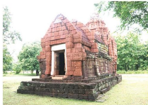
ปราสาทบ้านนุ อำเภอประโคนชัย

จนถูกเรียกเป็น “ พญานาคหัวลิ้น ” ซึ่งเป็นลักษณะเด่น ของศิลปะขอมแบบบาปวนที่ยังคงเอกลักษณ์ตกทอด มาจนถึงทุกวันนี้