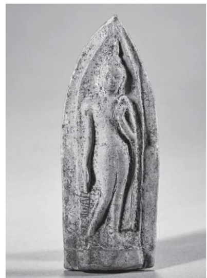
พระพิมพ์และแม่พิมพ์ลิลลา พระลิลลาถ้ำทาบ