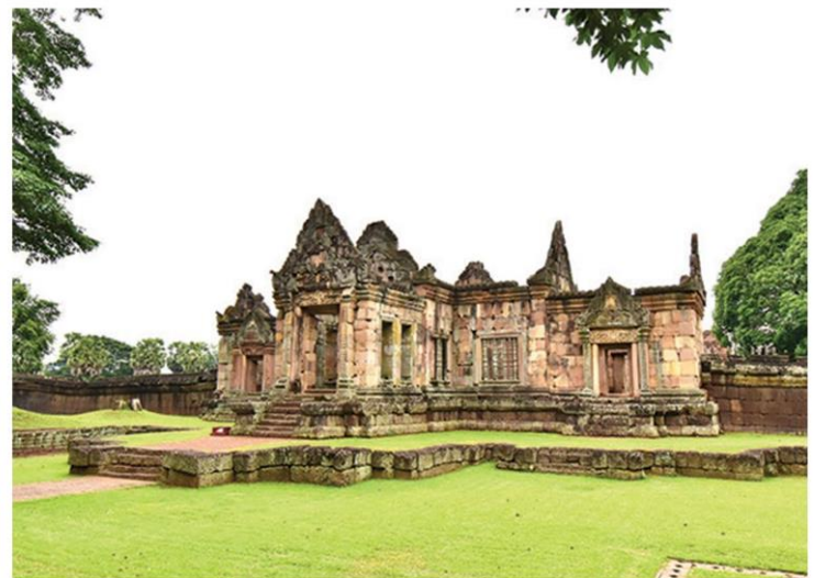
ด้านหน้าปราสาทเมืองต่ำ

ปรากฏ 3 องค์ ก่อด้วยอิฐตั้งอยู่บนฐานศิลาแลงต่อเนื่อง เป็นฐานเดียว หันหน้าไปทางทิศตะวันออก มีประตูเข้า ออกด้านหน้า ส่วนประตูอีก 3 ด้านเป็นประตูหลอก