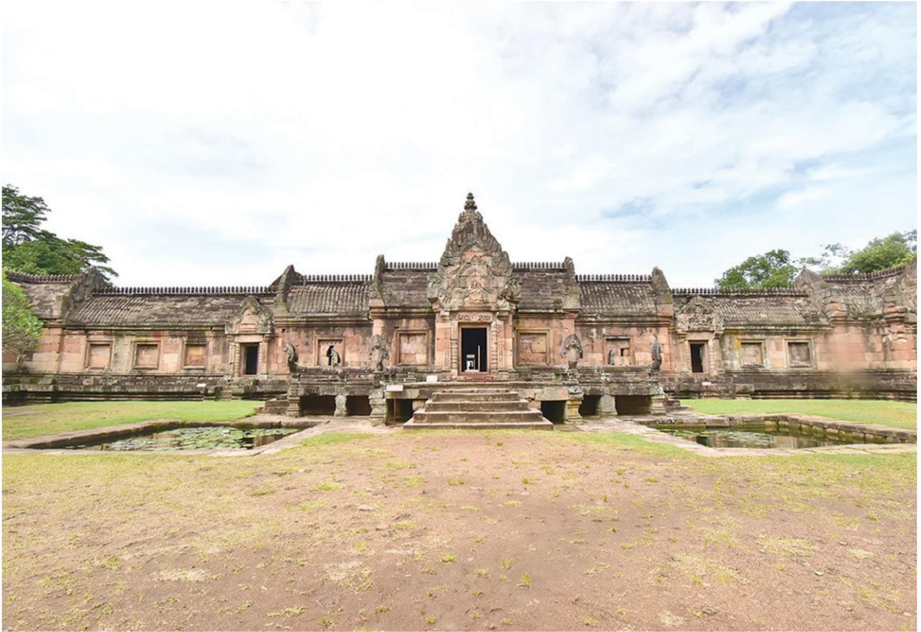
ปราสาทหินพนมรุ้ง

“บุรีรัมย์” เป็นเมืองแห่งปราสาทหิน เนื่องจากในสมัยโบราณดินแดนอีสานใต้ได้รับอิทธิพลสำคัญจากอารยธรรมขอม จึงมีการสร้างปราสาทขอมหรือปราสาทหินขึ้นอยู่ทั่วไปในแถบอีสานใต้ ครั้งนี้ขอพาทุกคนมาเยี่ยมชมความงามปราสาทหิน สถานที่ท่องเที่ยวไฮไลต์ที่ผู้มาเยือนจะต้องไม่ควรพลาด