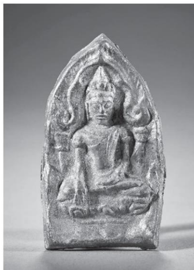
พระพิมพ์ปางมารวิชัยในซุ้มเรือนแก้ว