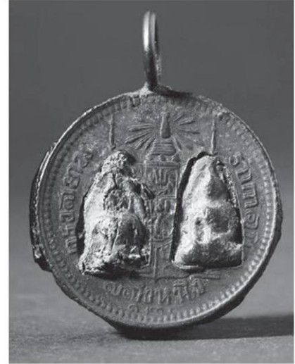
พระพิมพ์พระพุทธรูปปางสมาธิ แวดล้อมด้วยเครื่องสูง