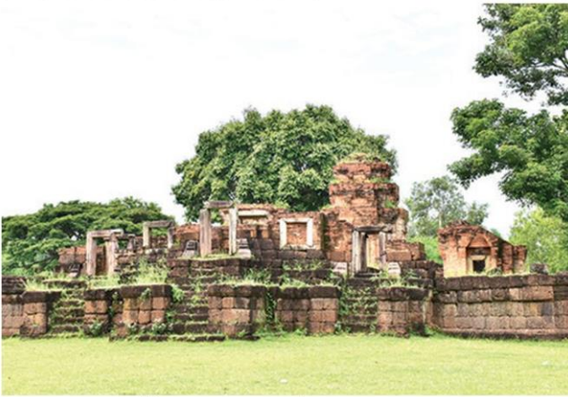
ปราสาทหนองหงส์ โบราณสถานขนาดเล็ก