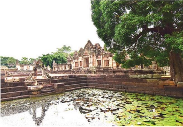
บารายที่สร้างรายรอบตัวปราสาททั้ง 4 ด้าน

หัวข้อข่าว: ปักหมุด 4 ปราสาทหินถิ่นภูเขาไฟ บุรีรัมย์ เที่ยวตามรอยอารยธรรมขอมโบราณ