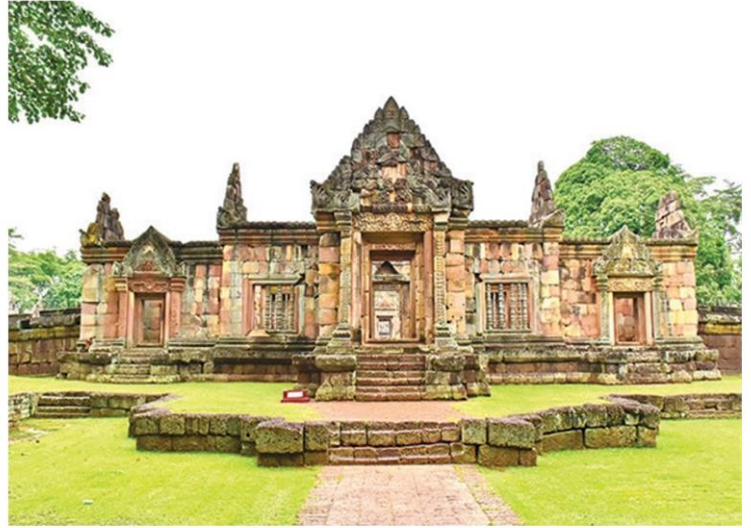
ปราสาทเมืองต่ำ (อำเภอประโคนชัย)