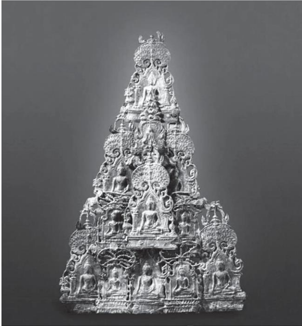
พระพิมพ์ปางมารวิชัยปรกโพธิ์ 11 องค์ กับพระพิมพ์ชินปางมารวิชัยในซุ้มเสมา 1 องค์ ติดประสานกัน ศิลปะอยุธยา พุทธศตวรรษที่ 20 หรือประมาณ 600 ปีมาแล้ว ชินบิตทอง พบภายในกรุพระปรางค์ วัดราชบูรณะ จังหวัดพระนครศรีอยุธยา