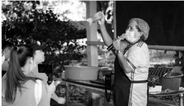
ฟังบรรยายการปลูก "ฟ้าทะลายโจร"

หัวข้อข่าว: 'ศูนย์ศึกษาการพัฒนาเขาหินซ้อนฯ' สวนสมุนไพรตามแนวทาง 'ศาสตร์พระราชา'