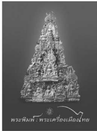
พระพิมพ์ : พระเครื่องเมืองไทย

กรมศิลปากรจัดพิมพ์หนังสือใหม่ “พระพิมพ์ : พระเครื่องเมืองไทย” รวบรวมองค์ความรู้เกี่ยวกับการดำเนินงานทางโบราณคดี ประวัติการค้นพบพระพิมพ์ตามแหล่งหรือกรุต่างๆ พร้อมแสดงภาพพระพิมพ์ พระเครื่องชิ้นสำคัญที่ขุดงาม หาชมได้ยากจากพิพิธภัณฑ์สถานแห่งชาติทั่วประเทศ ราคาเล่มละ 1,350 บาท “พระพิมพ์” เป็นพระพุทธรูปและรูปเคารพขนาดเล็กในพระพุทธรูปศาสนา สร้างขึ้นตามแบบพิมพ์ ด้วยมวลสารและวัสดุต่างๆ ตามศรัทธาและกำลังทรัพย์ผู้สร้างเพื่อสืบทอดพระพุทธรูปศาสนา หรือเป็นเครื่องรำลึกแทนพระพุทธรูปเจ้าสำหรับยึดเหนี่ยวจิตใจ พระพิมพ์แต่ละยุคสมัยพัฒนาการแปรเปลี่ยนไปตามความนิยมสังคม จนถึงสมัยรัตนโกสินทร์ คติการบูชาพระพุทธรูป