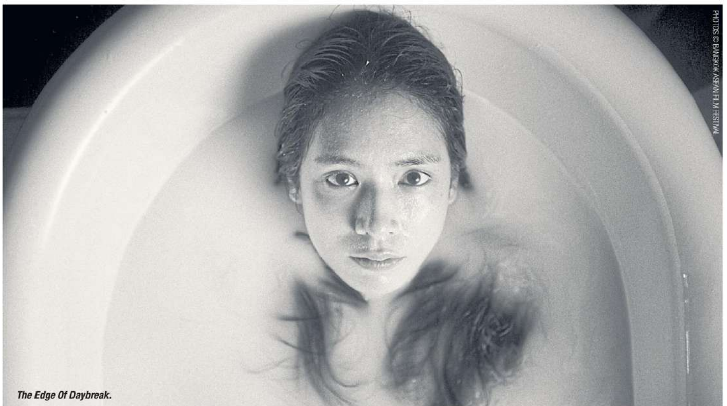
The Edge Of Daybreak.

Last year, despite the uncertainties brought by Covid-19, the festival took place in December and ran without a glitch. With the lockdown behind us now, the festival is one of the first major cultural events to take place in-person as Thailand is rallying to regain confidence from the international community.