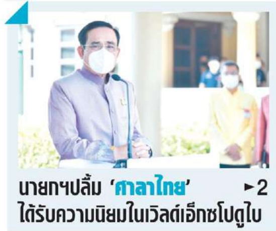
นายกฯ ปลื้ม 'ศาลาไทย' >2 ได้รับความนิยมในเวสต์เอ็กซ์โปดูไบ