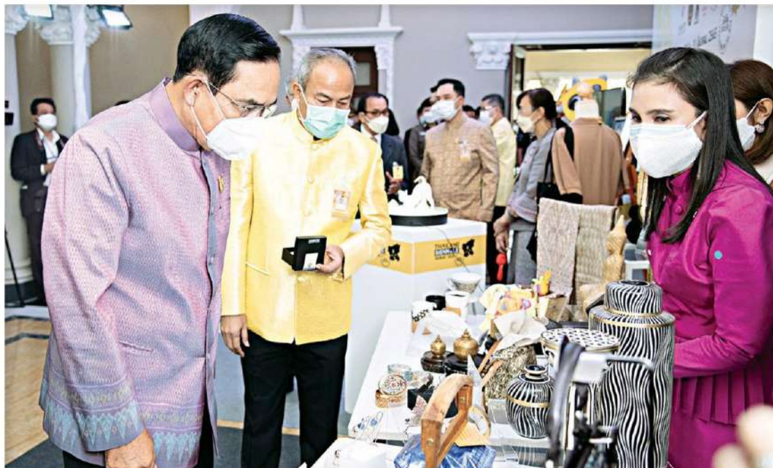
ชมงาน... พล.อ.ประยุทธ์ จันทร์โอชา นายกรัฐมนตรีและ รว.กลาโหม ชมผลงานหัตถศิลป์ไทยในการประชาสัมพันธ์จัดงานอัตลักษณ์แห่งสยามครั้งที่ 12 และ Crafts Bangkok 2021 โดยสถาบันส่งเสริมศิลปหัตถกรรมไทย (องค์การมหาชน) หรือ sacit ที่ทำเนียบรัฐบาล (ข่าวหน้า 2)

พล.อ.ประยุทธ์ แถลงภายหลังประชุม ครม. ถึงกรณีที่มีการหยิบยกคำพูดนายกฯ ที่พูดเรื่องการขึ้นทางด่วนไปโจมตีเรื่องความเหลื่อม