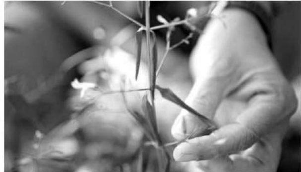
ต้นกล้า "ฟ้าทะลายโจร"