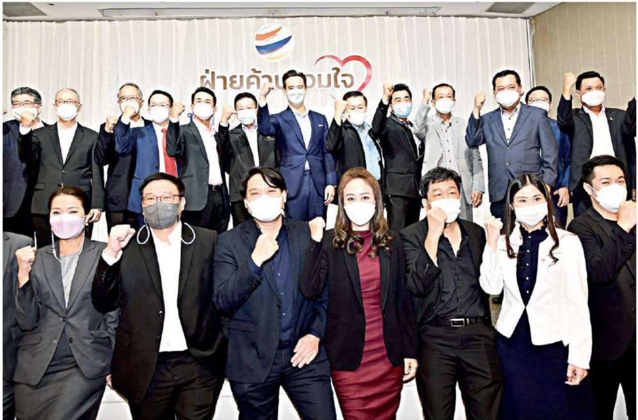
▲ ผนึกพลัง... น.พ.ชลน่าน ศรีแก้ว หัวหน้าพรรคเพื่อไทยและพรรคร่วมฝ่ายค้ำคูณใจจัดกิจกรรม “ฝ่ายค้ำคูณใจ สรรค์สร้างชีวิตใหม่เพื่อประชาชน” ท่ามกลางบรรยากาศลึกลับ โดยอ่านแถลงการณ์สรุปรัฐบาลบริหารราชการแผ่นดินในปี 64 สัมเลว 9 ข้อ ที่ห้องเทพลีลา โรงแรมเอสซี พาร์ค

ถ้าระหว่างคนรวยและคนจน พล.อ.ประยุทธ์ ย้อนถามลือว่า ใครเป็นคนหยิบคำพูดของตน มาเป็นประเด็น ก็คงจะอยู่แถว ๆ นี้ ขอให้ฟัง ยาว ๆ ว่าความหมายของนายกฯ คืออะไร ไม่ เห็นเห็นจะเขียนยุทธศาสตร์ชาติ 20 ปีไว้ทำไม ในเรื่องการแก้ไขปัญหาความเหลื่อมล้ำ ให้ ความเป็นธรรม เพิ่มขีดความสามารถ ตนพูด อธิบายแบบยาว ๆ แล้วลือก็ไปตัดต่อเอาตรง ไหนที่เป็นประเด็น ยืนยันว่าตนไม่ได้แบ่งแยก คนจนและคนรวย แต่เหตุผลของตนคือ ทุกคน เข้าถึงโอกาส เข้าถึงโอกาสของตัวเอง ซึ่งคนที่ พูดว่าก็ช่วยกัน รวบรวมข้างบนไม่คิด ข้างบนช่วย แบ่งเบาไปแล้วข้างล่างก็ไม่ติด ตนพูดเช่นนี้ 'ไม่ใช่หรือ จึงขออย่าให้เป็นประเด็นได้หรือไม่' 'ไม่ว่าจะทุกเรื่อง นายกฯ ก็หวังดีกับทุกคน พอ พูดมากไปก็ถูกคัดตอน พูดน้อยไปก็บอกว่าพูด 'ไม่รู้เรื่อง แล้วจะเอาอะไรกับตน