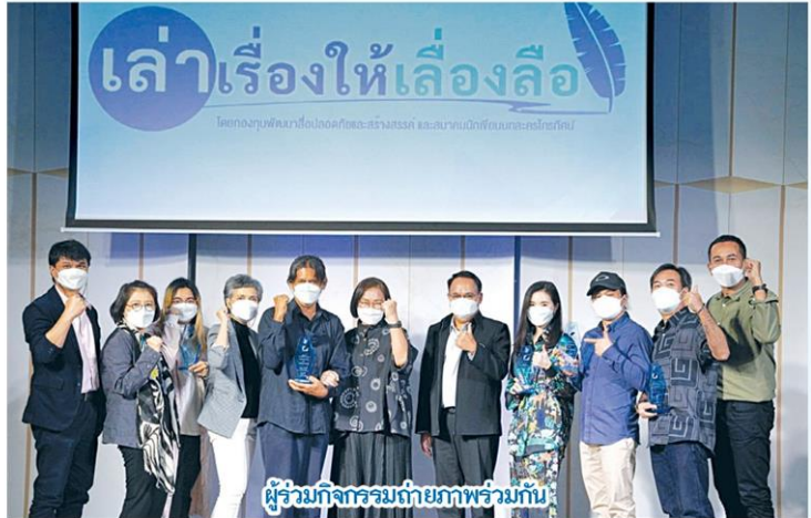
ผู้ร่วมกิจกรรมถ่ายภาพร่วมกัน