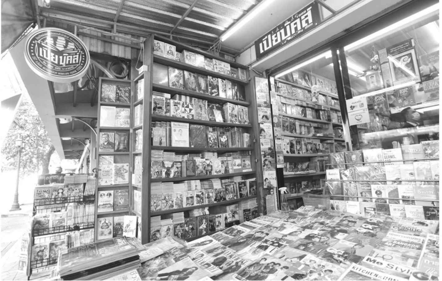
ร้านหนังสือเปียบุ๊คส์ จ.กรุงเทพฯ อยู่คู่ถนนดินสอ