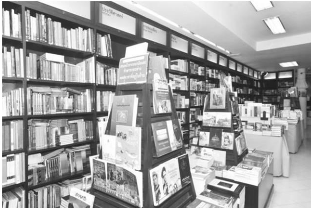
ร้านหนังสือริมขอบฟ้า สร้างสังคมการอ่าน