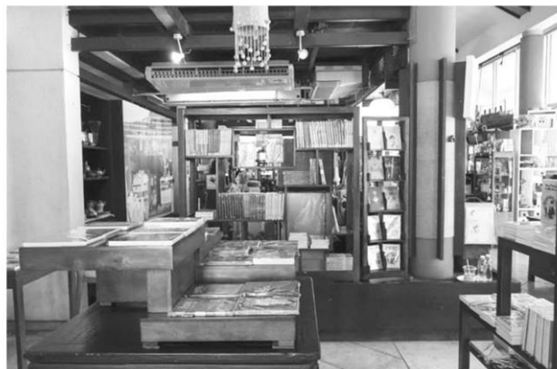
ร้านหนังสือดาวเจ็ดดวงในพื้นที่ร้านขนมเบี๊ยะตั้งเซ่งจ๊ว จ.ฉะเชิงเทรา

ในฐานะศิลปินแห่งชาติ สาขาวรรณศิลป์ ผাগในท้ายว่า ปัจจุบันประชากรร้อยละ 80 ของประเทศไทยไม่มีโอกาสเข้าถึงหนังสือ อย่าเข้าใจผิดว่าเทคโนโลยีทำให้คน