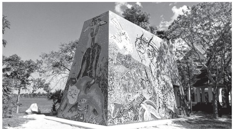
ผลงาน "ลิ้มอีสานร่วมสมัย" ศิลปิน องกรณ์ หล่อวัฒนา และ ท่มสวรรค์ อู่มานทรัพย์, สวน สาธารณะบึงตาท้าว