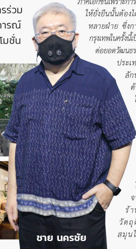
ชาย นครชัย