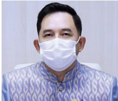
อิทธิพล คุณปลื้ม รมว.กระทรวงวัฒนธรรม