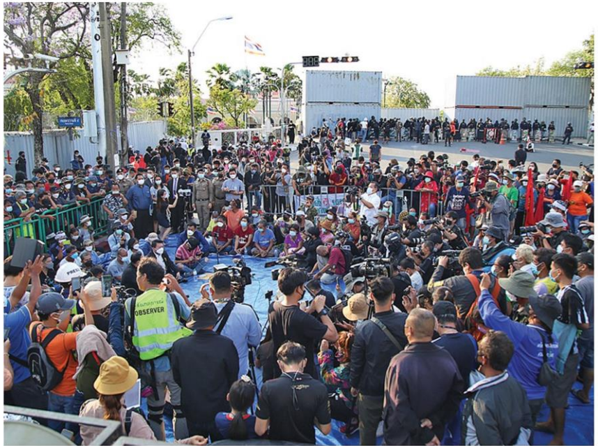
🏠 คุยพีมูฟ - นายอนุชา นาคาศัย รมต.ประจำสำนักนายกรัฐมนตรี นำมติครม.ที่รับข้อเรียกร้อง ทั้ง 15 ข้อมาแจ้งกลุ่มพีมูฟและเซฟบางกลอย โดยก่อนหน้านั้นเจ้าหน้าที่ตั้งตู้คอนเทนเนอร์และ ส่งศพ.สภ.คดีผู้ชุมนุมเข้าใกล้ทำเนียบรัฐบาล เมื่อวันที่ 1 ก.พ.

2.มอบหมายคณะกรรมการแก้ไข ปัญหาด้านคดีความกฎหมาย และกระบวนการ ยุติธรรม กับคณะทำงานศึกษาร่างกฎหมาย ว่า ด้วยการนิรโทษกรรมแก่ราษฎรซึ่งได้รับความ เสียหาย หรือได้รับผลกระทบจากการดำเนิน