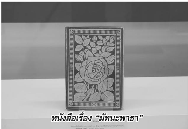
หนังสือเรื่อง "มัทนะพาธา"

ท่องเที่ยว ประโยชน์ของการเที่ยว การเสด็จประพาสในรัชกาลที่ 5 รัชกาลที่ 6 รัชกาลที่ 7 การท่องเที่ยวทั่วไทย ผ่านหนังสือหายาก ในหมวดท่องเที่ยวนี้เป็นการเดินทางย้อนไปในเหตุการณ์ สถานที่ และผู้คน ซึ่งไม่เคยมีใครได้พบเห็นผ่านจินตนาการของแต่ละคน มีทั้งเรื่องภาคเหนือ ล่องลำน้ำโขง ตั้งแต่เมืองเชียงใหม่ ถึงปากน้ำโพธิ์ จากจดหมายเหตुरะยะทางเสด็จหัวเมืองเหนือ ภาคอีสาน พาเที่ยวตามทางรถไฟ เรื่องเที่ยวที่ต่างๆ ภาคที่ 4 ว่าด้วยเที่ยวมณฑลอุดร แล มณฑลอิสาน นิราศหนองคาย เรียกว่าเที่ยวทั่วสยามเลย นอกจากไขว้หนังสือแล้ว มีภาพการเดินทางและสถานที่ท่องเที่ยวประกอบ