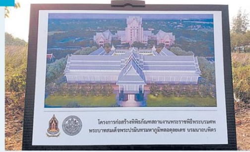
สร้างพิพิธภัณฑ์สถานพระราชพิธี ถวายพระเพลิงพระบรมศพ ร.9 >8