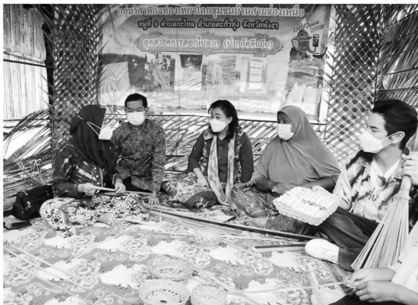
ต้นแบบ - นางยุพา ทวีวัฒนะกิจบวร ปลัดกระทรวงวัฒนธรรม นำคณะ เชี่ยวชม การลอบใบจาก ของชาวบ้าน ในการเป็นประธานพิธีเปิด ‘เที่ยวชุมชน ชลวิถี’ ชุมชน คุณธรรมฯ ที่บ้านสามช่องเหนือ ต.ทะเล อ.ตะกั่วทุ่ง จ.พังงา

ปีงบประมาณ 2565 วธ.จะดำเนินโครงการ “เที่ยวชุมชน ชลวิถี” อย่างต่อเนื่อง โดยจะดำเนินการคัดเลือก สูดยอดชุมชนต้นแบบ “เที่ยวชุมชน ชลวิถี” อีกจำนวน 10 ชุมชนจากชุมชนที่เข้าร่วมโครงการ ทั้งหมด 228 ชุมชน ทั่วประเทศ