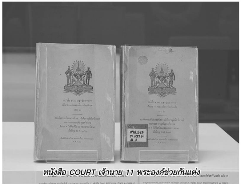
หนังสือ COURT เจ้านาย 11 พระองค์ช่วยกันแต่ง

และโซน "เพราะหนังสือจึงสร้างสรรค์" เนื้อหาเกี่ยวกับ หอสมุดแห่งชาตินำหนังสือหายากมารังสรรค์และต่อยอดพัฒนาจัดทำเป็นของที่ระลึกในโอกาสต่างๆ ได้แก่ การพิมพ์หนังสือ (Reprint) ช่วยอนุรักษ์ต้นฉบับและสืบทอดอายุหนังสือให้คงอยู่ต่อไป การสร้างสรรค์ผลิตภัณฑ์ โดยนำลักษณะเด่นของหนังสือหายาก เช่น