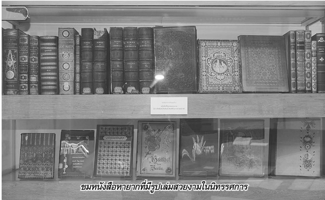
ชมหนังสือหายากที่มีรูปเล่มสวยงามในนิทรรศการ