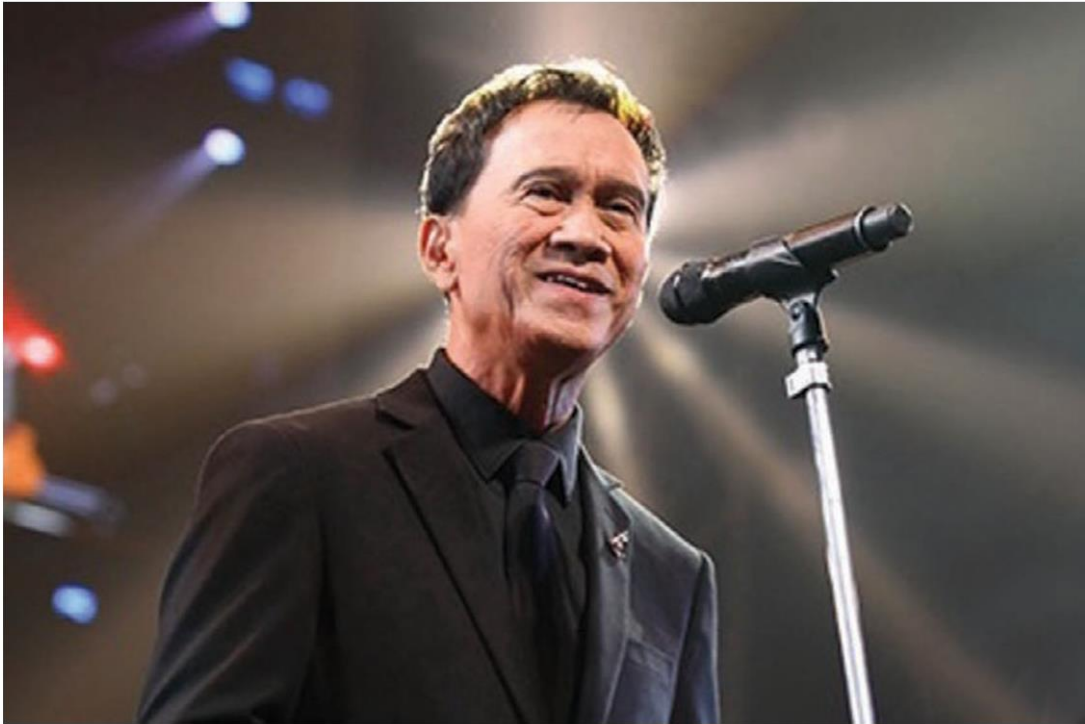
สูญเสี - นายเศรษฐา ศิระฉายา หรือ "อาต้อย" ศิลปินแห่งชาติสาขาศิลปะการแสดง (ดนตรีไทยสากล-ขับร้อง) ประจำปี 2554 เสียชีวิตเมื่อเวลา 04.42 น. วานนี้ (20 ก.พ.) ด้วยโรคมะเร็งปอด ในวัย 77 ปี กำหนดสวดพระอภิธรรมศพ ถึงวันที่ 27 ก.พ. 65 ณ ศาลา 1 วัดเทพศิรินทราวาส กทม.