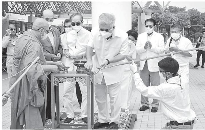
ชาย นครชัย อธิบดีกรมส่งเสริมวัฒนธรรม เป็นประธาน ประกอบพิธี เททองหล่อพระพิมพ์นศ รุ่ยมหาเทวารราชาโชคลาก โดยมีศิลปินแห่งชาติมาร่วม งานด้วย ที่ลานหน้าหอประชุมใหญ่ ศูนย์วัฒนธรรมแห่งประเทศไทย.