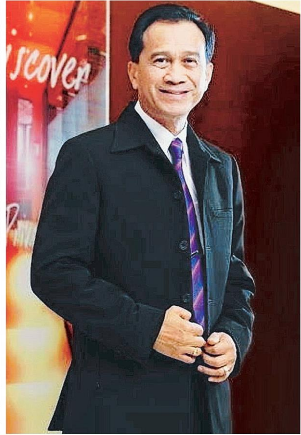
▶ ปิดตำนาน นักร้องนักแสดงพิธีกรอาวุโสระดับตำนานและศิลปินแห่งชาติ อาต๋อย-เศรษฐา ศิระฉายา เสียชีวิตจากโรคมะเร็งปอดด้วยวัย 77 ปี ที่รพ.จุฬาราชกุมาร ภาพซ้ายเป็นศิลปินที่ "น้องมีบุญ" หลานชาย เข็นรถวีลแชร์ให้คุณตา เป็นช่วงท้ายที่ได้เห็นเศรษฐาในโรงพยาบาลก่อนจากไปไม่มีวันกลับ.

มะเร็งมาอย่างเข้มแข็งตลอด 2-3 ปีมานี้ ช่วงหลังที่อาการแย่งหนักเลยคือทานอาหารไม่ได้แต่ทนพูดกับพ่อว่าสู้ไปด้วยกันนะ พ่อก็บอกว่าจะสู้ ซึ่งพ่อก็สู้จริงๆ พวกเราเป็นกำลังใจแม่เองเฝ้าอยู่ข้างเตียงดูแลพ่ออย่างใกล้ชิดจนมากจนเมื่อ 2 วันก่อนพ่อมีนัดคุณหมอของเตียงไว้ให้ตนเห็นว่าดีมากพ่อจะได้เข้าไปให้สารอาหารร่างกายจะได้แข็งแรงขึ้นเลยบอกกับพ่อว่าตนจะไปดูงานที่เกาะเสม็ด พ่อโอเคนะ ปกติแม่จะอยู่ดูแลพ่อก็ขอแม่ไปด้วยกันเพราะที่ผ่านมาแม่เหนื่อยมากอยากให้ได้พักผ่อนบ้างตนไปครั้งนี้ไม่คิดว่าจะมีอะไร จนเมื่อตอนเย็นได้รับแจ้งว่าพ่อความดันตกตั้งแต่ตอนบ่ายแล้วก็คอยติดต่อเช็กอาการตลอด จะกลับก็ไม่ได้ต้องรอเรือ จนเมื่อตอนตีสองได้รับแจ้งว่าพ่ออาการไม่ดีได้บอกพ่อทางโทรศัพท์ว่าพ่อไม่ต้องห่วงอะไรนะจะดูแลแม่อย่างดี รู้นะว่าหนูรักพ่อมาก จนเมื่อตี 4 เศษพ่อก็จากไปอย่างสงบ