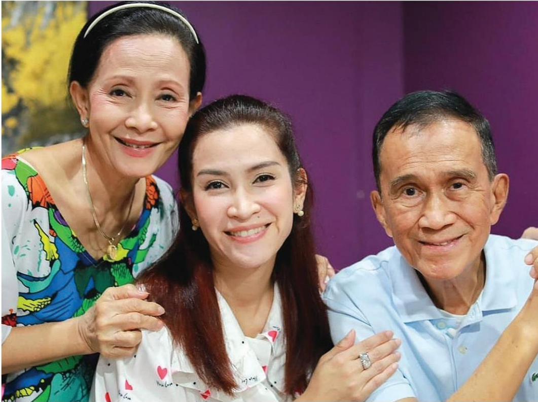
🏠 สุดอาลัย - อาต้อย-เศรษฐี ศิระฉายา อดีตนักร้อง-นักแสดงรุ่นใหญ่ และศิลปินแห่งชาติ เสียชีวิตแล้วด้วยโรคมะเร็งปอด ในวัย 77 ปี เมื่อวันที่ 20 ก.พ. ครอบครัวนำร่างประกอบพิธีศพที่วัดเทพศิรินทราวาสราชวรวิหาร กทม.