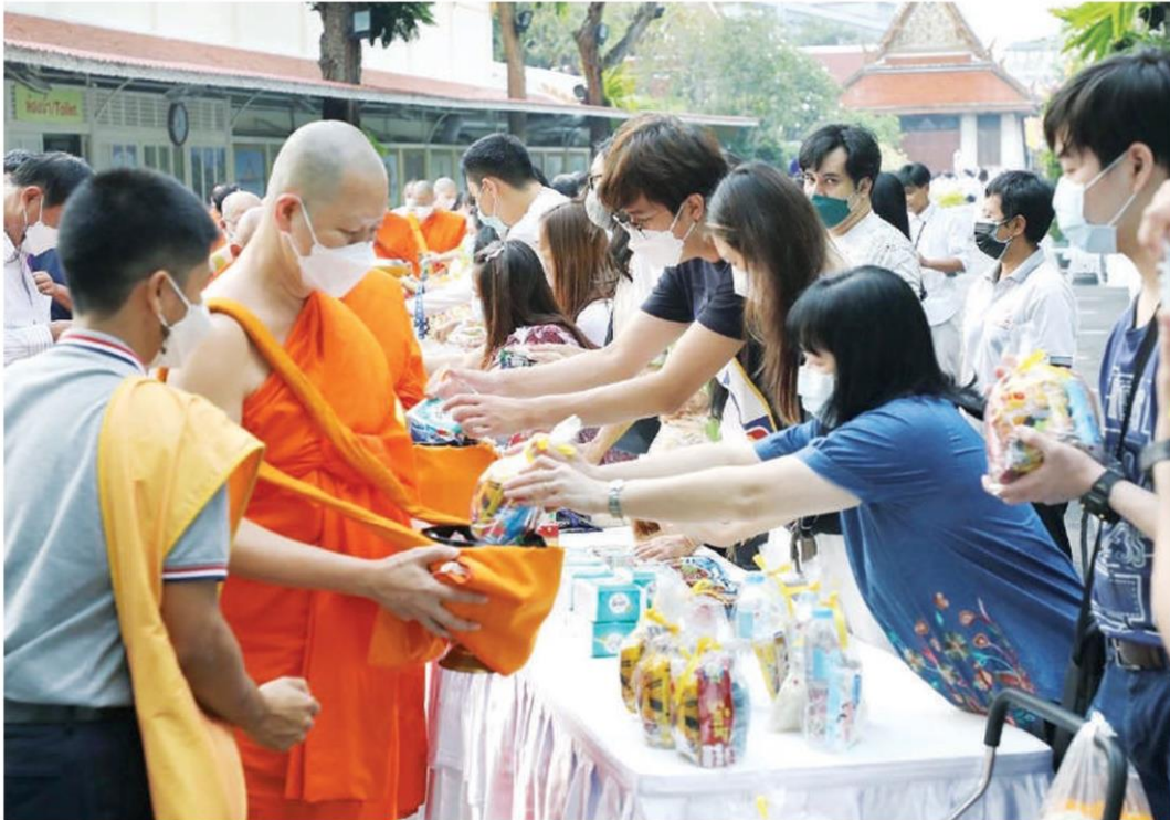
นายอิทธิพล คุณปลื้ม รัฐมนตรีว่าการกระทรวงวัฒนธรรม เป็นประธานฝ่ายฆราวาส ในพิธีเจริญพระพุทธมนต์ ตักบาตรและเวียนเทียน เนื่องในวันมาฆบูชา ที่วัดสระเกศ วานนี้ (16 ก.พ.)