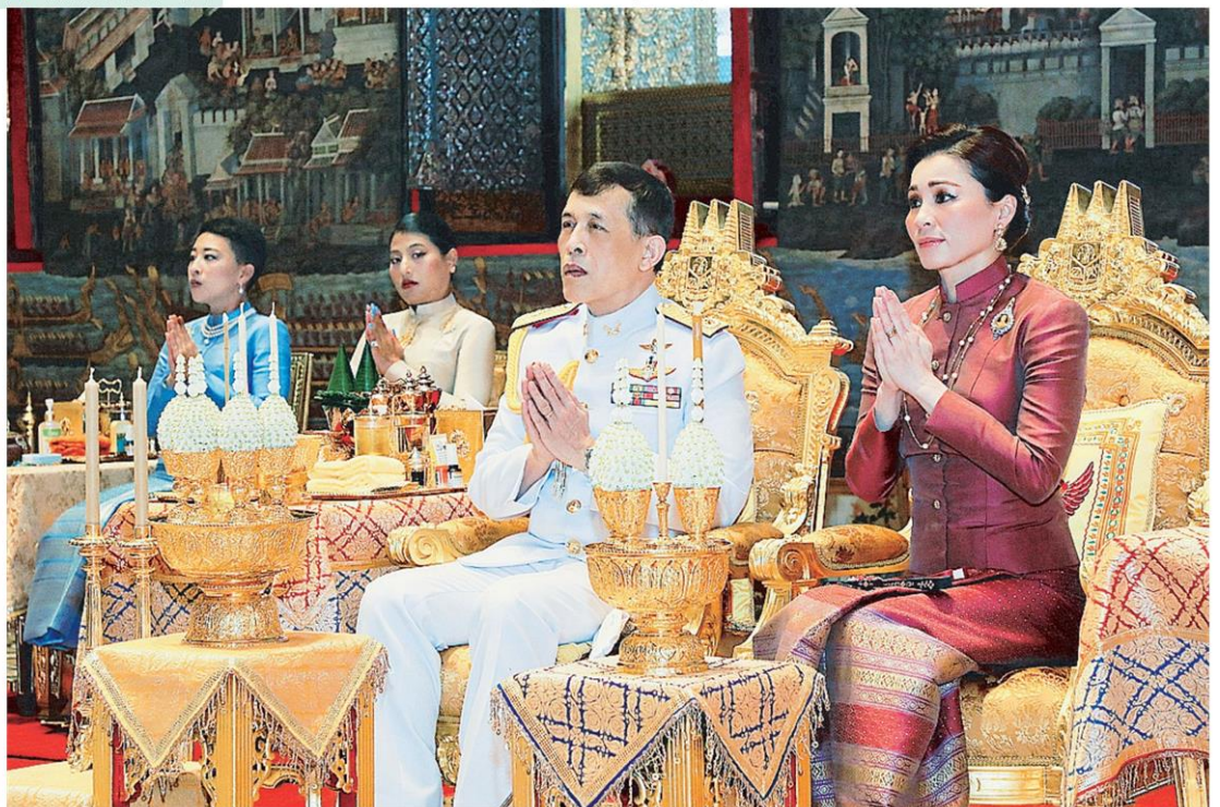
พระบาทสมเด็จพระเจ้าอยู่หัว และ สมเด็จพระนางเจ้าฯ พระบรมราชินี พร้อมด้วย สมเด็จพระเจ้าลูกเธอ 2 พระองค์ เสด็จฯ ไปในการพระราชพิธีทรงบำเพ็ญพระราชกุศลมาฆบูชา พุทธศักราช 2565 ณ พระอุโบสถวัดพระศรีรัตนศาสดาราม.

จากนั้น พระบาทสมเด็จพระเจ้าอยู่หัว เสด็จไปทรงจุดธูปเทียนเครื่องนมัสการทองใหญ่ที่หน้า