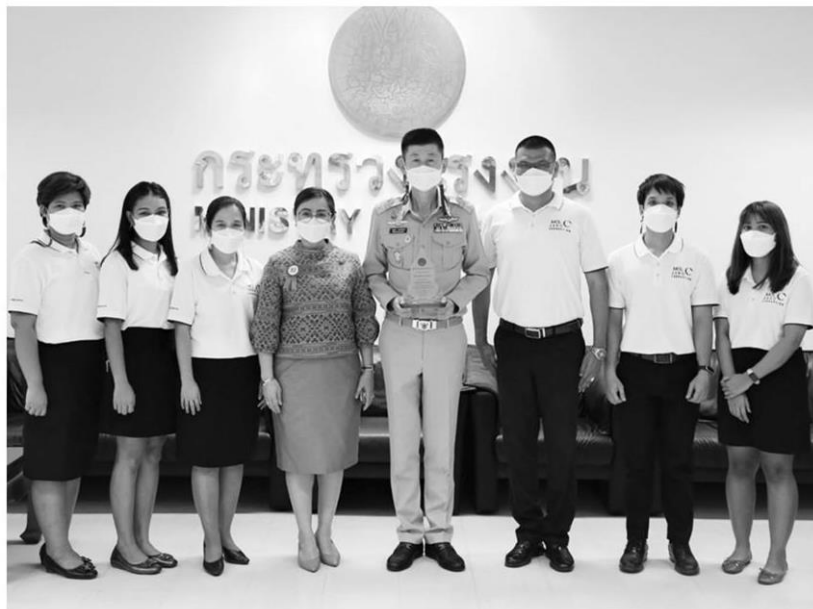
รับมอบโล่รางวัล ● กระทรวงแรงงาน รับมอบโล่รางวัลองค์กรคุณธรรมต้นแบบโดดเด่น จัดโดยกระทรวงวัฒนธรรม โดยมี บุญชอบ สุทธมนัสวงษ์ ปลัดกระทรวงแรงงาน และนุพผา เรืองสุด รองปลัดกระทรวงแรงงาน เป็นผู้รับมอบ