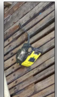
ตลับเมตร