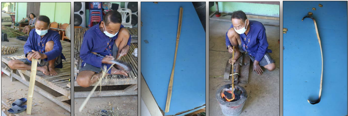
การเหลาซี่มือเสือ

ก่อไฟในเตาถ่านโดยใช้ถ่านเป็นเชื้อเพลิง (จะได้ความร้อนที่สม่ำเสมอ ไม่แรงจนเกินไป) นำซี่มือเสือที่เหลาได้รูปและพร้อมตัดแล้วไปแช่น้ำ ประมาณ ๒ - ๓ นาที จากนั้น นำปลายด้านหนึ่ง ซึ่งเป็นบริเวณที่ต้องการตัด โค้ง งอ ไปลงไฟ โดยพลิกไปมา ประมาณ ๓๐ วินาที แล้วนำไปตัดในเครื่องตัด (เครื่องตัด นายสวนฯ ประดิษฐ์คิดค้นขึ้นมาใช้เอง เพื่อสะดวกในการตัด โค้ง งอ และองศาความโค้งของซี่มือเสือแต่ละซี่จะเท่ากัน สวยงาม) โดยให้ด้านผิวไม้ไผ่อยู่ด้านนอกมุมโค้ง การตัดต้องตัดเพียงครั้งเดียวให้ได้รูปทรงเลย ถ้าตัดหลายครั้งรูปทรงก็จะเสียไป (ขั้นตอนนี้ต้องใช้ทักษะและประสบการณ์ เพราะถ้าลงไฟน้อยเกินไป จะทำให้ซี่มือเสือดัดงอไม่ได้ ถ้าตัดก็จะแตกหัก หรือถ้าลงไฟนานเกินไปจะทำให้ซี่มือเสือไหม้ หรือกรอบ ถ้าตัดก็จะแตกหัก) จากนั้น ให้ทำกับซี่มือเสืออีกด้านเหมือนกัน จนครบทั้ง ๕ ซี่