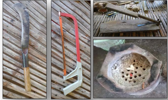
วัสดุอุปกรณ์