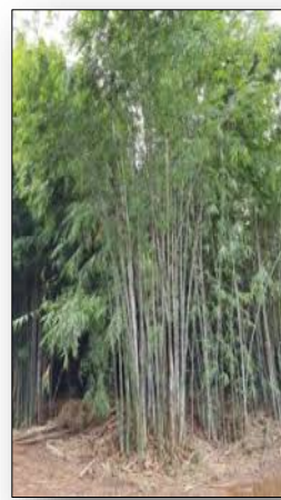
ไผ่สร้างไพร