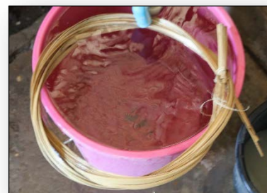
ตอกสานยึดซี่มือเสือ

(๒) เหลาไม้ไผ่ให้มีลักษณะแบนราบ และอ่อน จนสามารถสานหรือดัดโค้งงอไปมาได้ โดยให้เหลือด้านที่เป็นผิวเปลือกไว้ เสร็จแล้วม้วนเก็บแล้วนำไปแช่น้ำเพื่อเตรียมใช้งานต่อไป