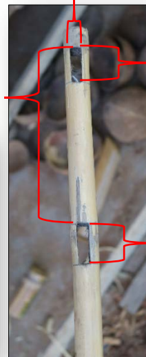
ด้ามมือเสือ