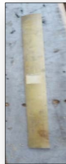
ไม้ประกอบ