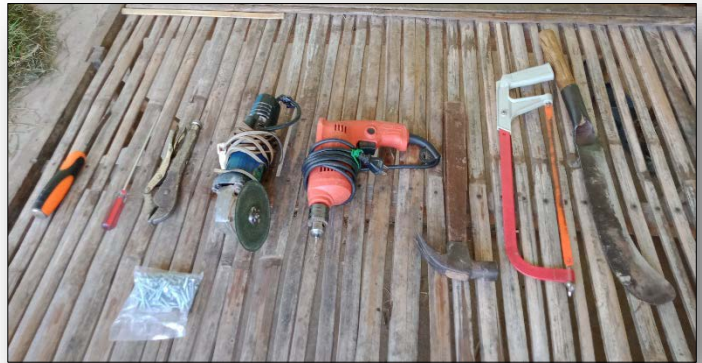
อุปกรณ์ที่ใช้ประกอบมือเสือ