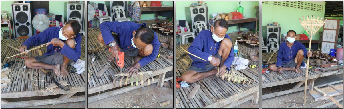
การประกอบมือเสื่อ